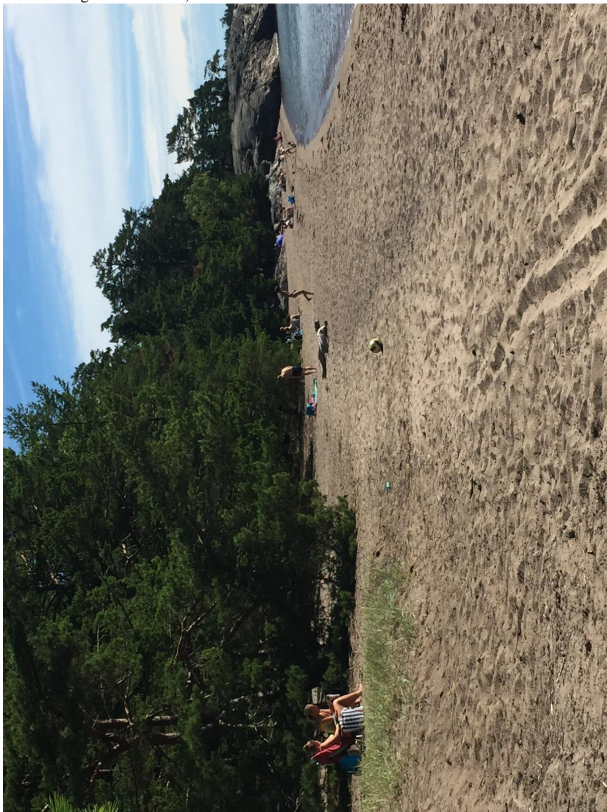
Bild 1. Fotografi Stora Sand, minst 52 badande