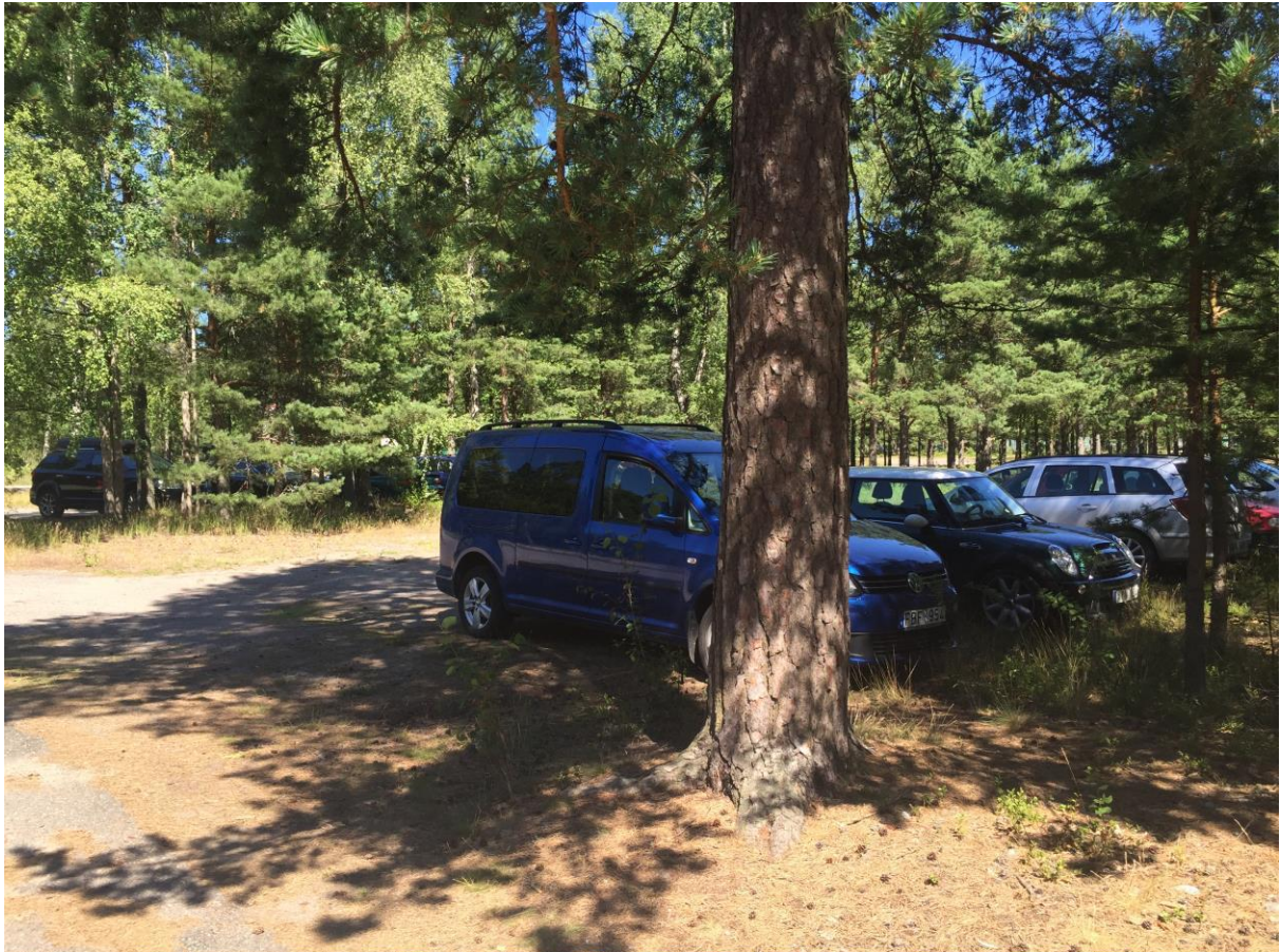
Bild 10, 11 och 12. Parkerade bilar på parkeringen