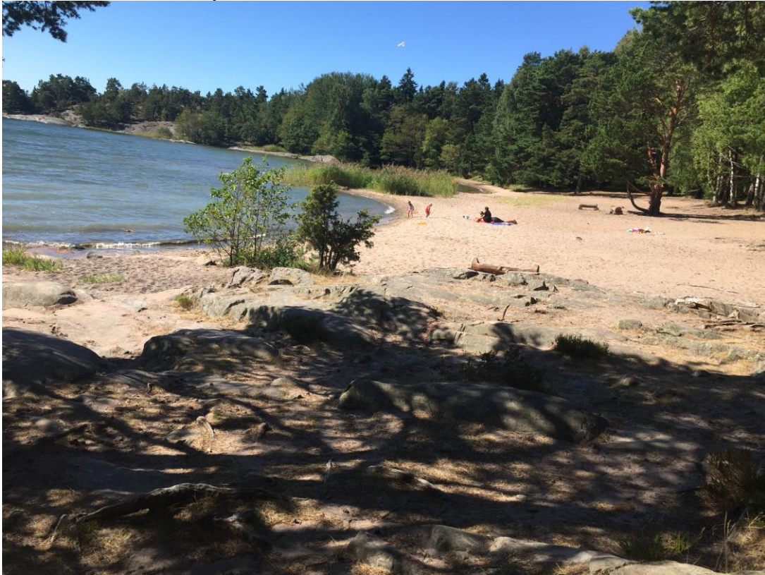
Bild 2. Badande ca 30 stycken