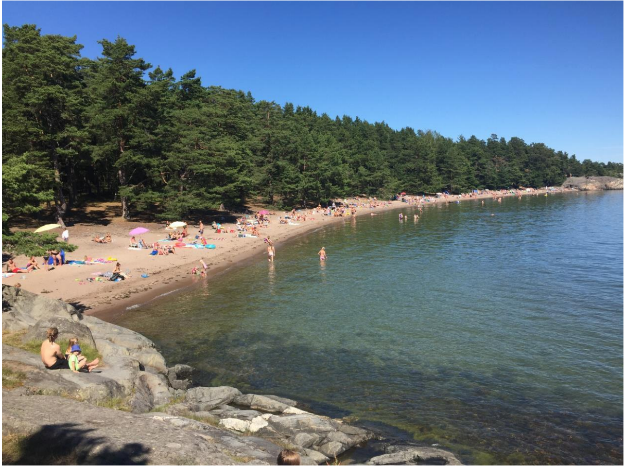
Bild 20. Livboj