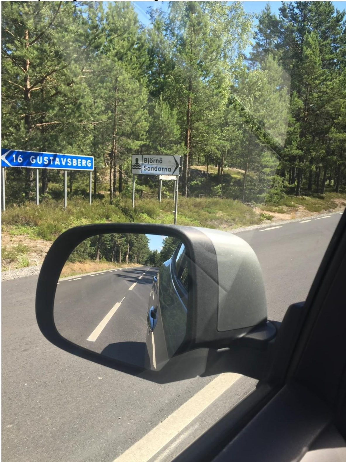
Bild 1. Skylt vid väg 653 från Gustavsberg mot Klacknäset