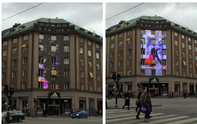
35. 36. Korsningen Sveavägen/Kungsgatan. Ledbelysning på hel fasad som lekfullt blandar och varierar konst och reklam testas under en begränsad tid med tidsbegränsat bygglov.

stadsbilden. Bygglov för dessa typer av skyltar ställer därför särskilt höga krav på anpassning till platsen och byggnaden och skyltens kvalitet.