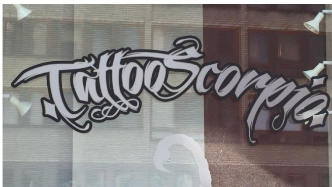
8. Fleminggatan. En väldigt enkel skyltlösning som kräver minimalt med energiåtgång är foliering på insidan av fönster.

Elektroniska skyltar innehåller mycket teknik och kräver mer energi än traditionella skyltar. Stockholm har högt ställda miljömål och stadsbyggnadsnämnden vill därför särskilt uppmuntra alla stockholmare att hitta så energismarta lösningar som möjligt i varje enskilt fall.