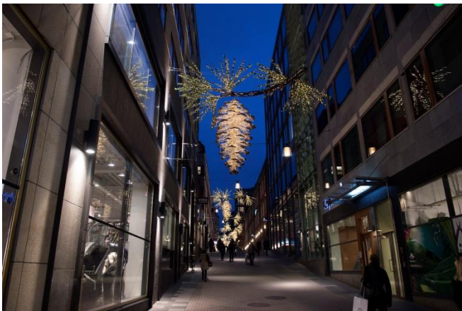
22. Jakobsgatan. Här är gaturummet dekorerat under december och januari.

Stämningsbelysning under advent, jul- och nyårshelgerna behöver inte bygglov.