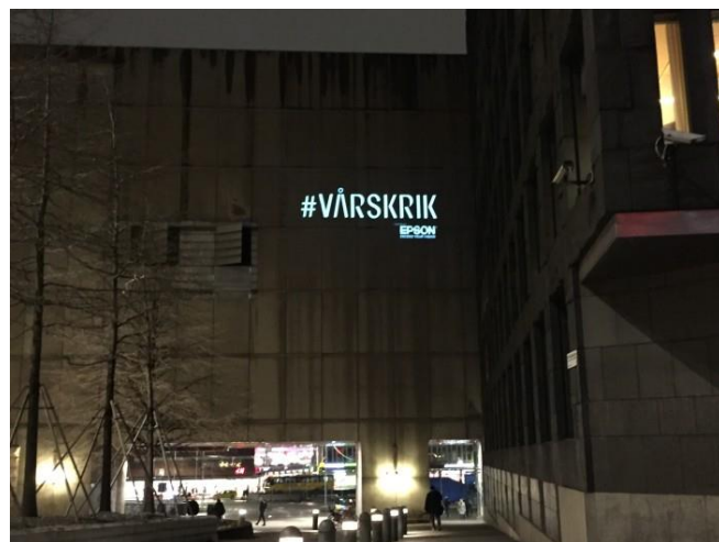
44. Kulturhuset (mot Beridarbansgatan). En tät fasad får ett tillfälligt tillskott med ett lysande budskap utan att plåtfasaden påverkas.

Projicering av ljus på en trottoar eller fasad blir allt vanligare. Projektioner är ett enkelt sätt att få uppmärksamhet utan att göra åverkan på markbeläggning eller fasad. Speciellt synlig blir dessa sorters skyltar förstas under de mörka vintermånaderna. Projektioner kan dock störa gående, närboende och/eller trafik och man behöver därför vara särskilt noga när man riktar ljuset.