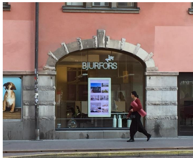
12. St Eriksgatan. En del fasader har många vackra detaljer och olika former. När det inte finns någon given plats för en skylt på fasaden kan en skylt inne i skyltfönstret vara ett gott val. De här sitter så nära rutan att de upplevs som om de vore fasadskyltar och därför behövs bygglov.

Skyltar innanför skyltfönster behöver normalt inte bygglov. Men sitter de väldigt nära fönsterrutan upplevs de som om de satt utanför och då behövs bygglov. Ett riktmärke är att hålla sig 50 cm innanför glaset för att bygglov inte ska behövas. Lyser skylten väldigt starkt ut på gatan och kan störa grannar och trafiksäkerheten gör det också att den upplevs som en skylt som behöver bygglov.