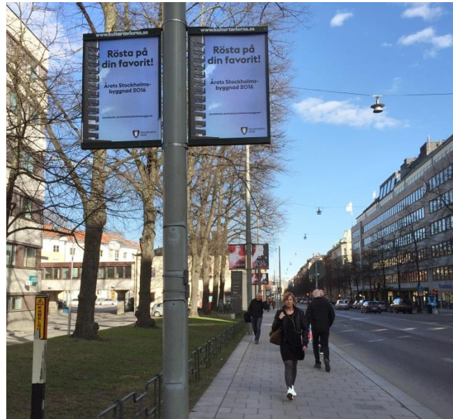
21. Fleminggatan. Information från Stockholms stad och från ett av stadens museer.

Kulturtavlor kallas de mindre, långsmala skyltarna som sitter på lyktstolpar längst med vissa gator i staden. De informerar om angelägna evenemang, kulturhändelser och allmän information från staden. De behöver inte bygglov.