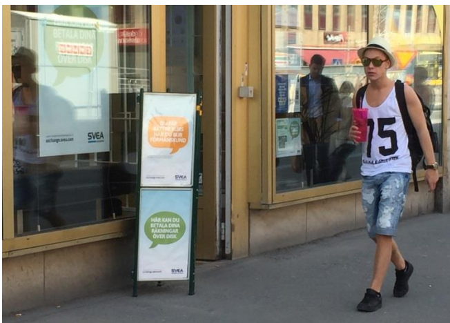
18. Klarabergsgatan. Överdagensskylten är väl placerad invid fasaden så att tillgängligheten på trottoaren påverkas så lite som möjligt.

behöver inte bygglov. De behöver dock upplåtelsestillstånd från stadens trafikkontor.