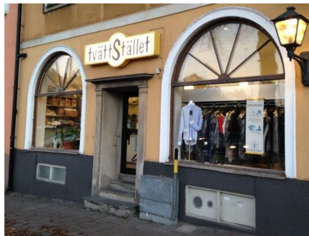
33. Alviksvägen. Låds skylten är placerad mitt över entrépartiet. "Cirkeln" i mitten av skylten hänger ihop med de välvda skyltfönstren och gör också att skylten ser bearbetad ut till sin utformning.

Med dagens teknik kan låds skyltar göras mycket tunna, till skillnad från tidigare tjocka lådor. De täcker fasaden och dess detaljer och kan vara svåra att anpassa i känsliga miljöer.