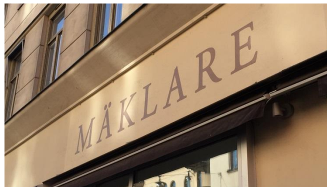
43. Scheelegatan. Skyltband i samma färg som fasaden, bokstäver i en kulör som är anpassad till fasadens färgskala, bokstäverna har ett respektavstånd till fasaddetaljer, inga varumärken gör att ommålning inte behövs vid varumärkesbyten.

Fasadmålning är en enkel lösning på skyltning men ställer krav på en fräsch och oskadad fasad. Byte av skyltbudskap kräver ommålning, vilket kan vara omständligt om ytan att måla om är betydligt större än själva skyltområdet.