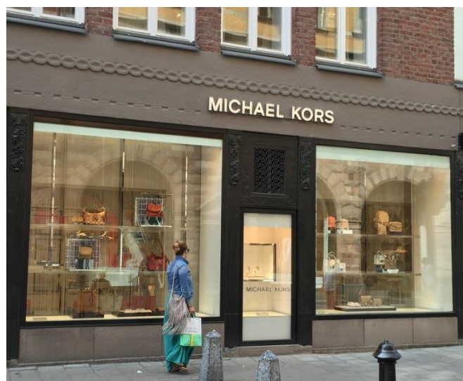
30. Biblioteksgatan. Friliggande bokstäver fastsatta på diskret skena i nederkant. Skylten centrerad över entrén och med avstånd från relieferna.

Friliggande bokstäver fungerar ofta även i kulturhistoriskt krävande miljöer. För att begränsa antalet infästningshål kan bokstäverna fästas på en balk eller skena.