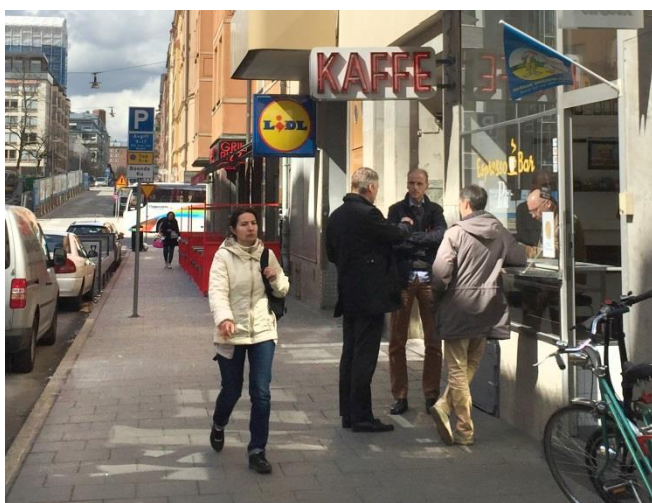
37. Sankt Göransgatan. Här är två exempel på flaggskyltar där den ena visar vilken typ av vara som säljs och den andra är en varumärkesskylt. Båda fyller sin funktion i stadsrummet.

Flaggskyltar är kanske den allra vanligaste typen av skylt i stadsmiljö. De är särskilt användbara i trånga gaturum där fasadskyltar kan vara svåra att se på håll. Tänk särskilt på höjden 3,0 meter över gatan för att inte försvåra trottoarstädning, snöskottning etc.