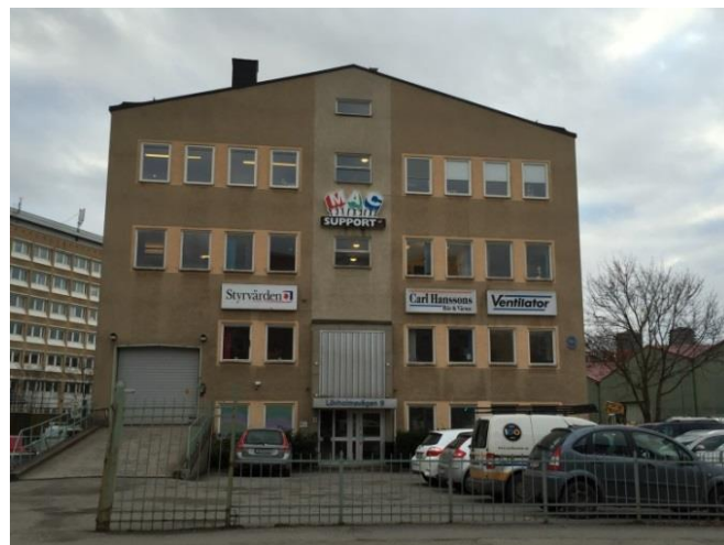
29. Lövholmsvägen. Enkel skyltning där alla skyltar är utformade som lådor. Skyltarna i samma fasadband har samma storlek och form och är placerade i liv med byggnadens fönster. Skyltningen passar väl ihop med byggnadens karaktär.

Här följer ett antal bildexempel med tillhörande bildtexter på väl placerade och utformade skyltar och ljusanordningar.