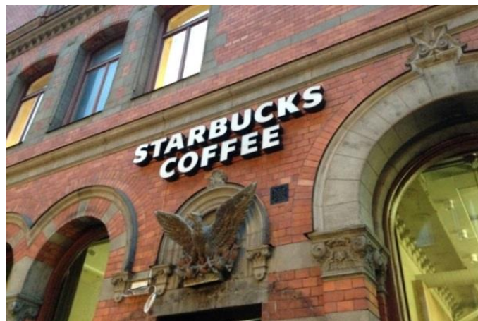
25. Götgatan. Ny verksamhet i gammal byggnad. Fristående bokstäver gör att husets tegelfasad fortfarande syns. Skylten är placerad symmetriskt mellan valven och mitt över den karaktäristiska skulpturen. Respektavstånd finns mellan skylten och övriga fasadelement.