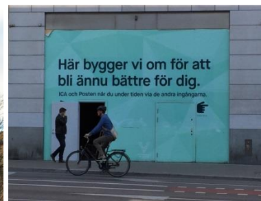
15. Mariebergsgata. Byggplatsskylt på ställning inne på samma fastighet där bygget pågår.