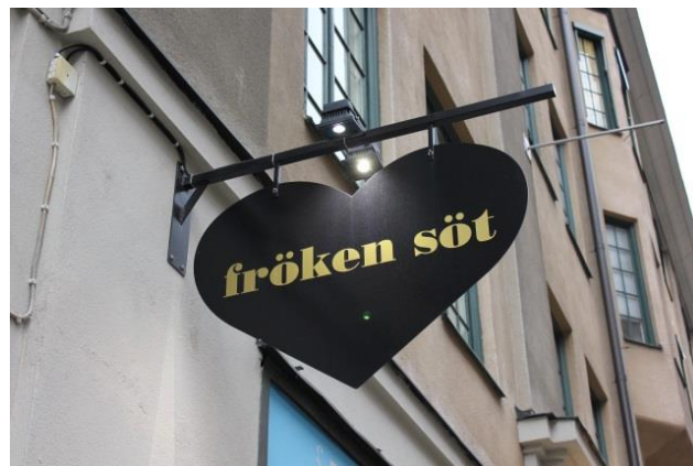
38. Götgatan. Pendelskyltar kan enkelt och relativt billigt göras i personlig form som inte konkurrerar med fasadens dekorationer. Det är denna ett fint exempel på.

För att synas längs med en gata är en pendelskyltar en mycket vanlig lösning. De går oftast enkelt att anpassa till byggnaden. Tänk särskilt på höjden 3,0 meter över gatan för att inte försvåra trottoarstädning, snöskottning etc.