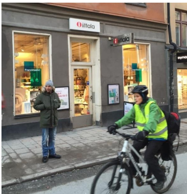
5. Götgatan. Där de förbipasserande är gående och cyklister syns skyltarna väl även i litet format.

Alla skyltar ska anpassas till betraktaren och till hastigheten som denne rör sig i. En bra skylt är tydlig och lättläst. En begränsad mängd information eller en väl inarbetad symbol är oftast lätta att uppfatta. Skylten ska ge samman möjligheter för rörelsehindrade och synsvaga att delta i stadslivet. Skyltarna ska också underordnas byggnaderna och vårt gemensamma stadsrum.