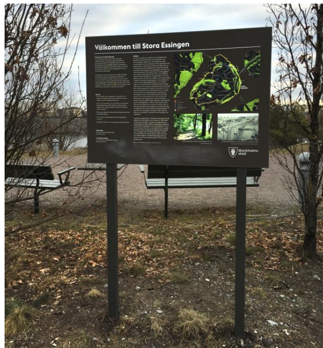
20. Broparken. Tavla med karta och information om park, gångvägar etcetera på Stora Essingen.

Olika sorters tavlor kan behövas för hänvisningar och information till allmänheten. Dessa tavlor behöver inte bygglov, men ska inte förväxlas med fristående samlingsskyltar för verksamheter vid exempelvis industriområden som behöver bygglov.