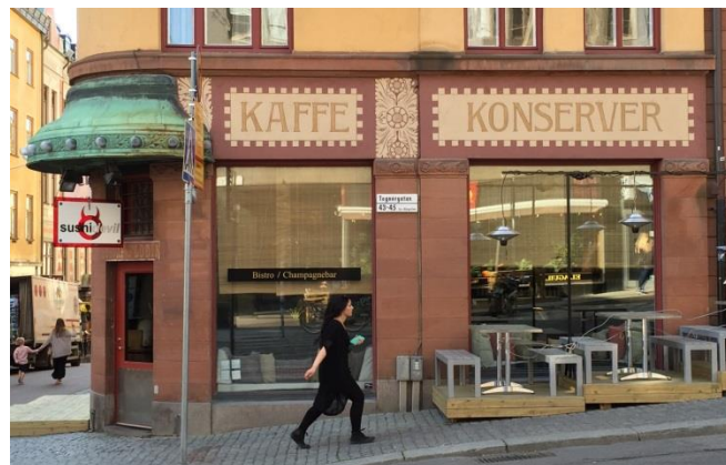
6. Tegnérgatan. De äldre, fasadmålade skyltarna finns kvar även om lokalen används för annat nu, med ny skyltning i helt annan form över entrédörren.

Äldre skyltar berättar också en historia om vad byggnaden har använts till under årens lopp och har på så sätt i sig ett högt kulturhistoriskt värde. Behåll om möjligt vackra, äldre skyltar och bidra på så sätt till att skapa spännande kulturlager!