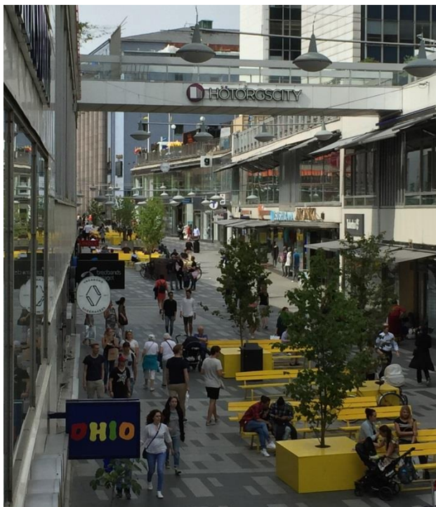
2. Sergelgången. Skyltningen för respektive butik är koncentrerad till gatunivån där människorna rör sig – en naturlig del av stadslivet.