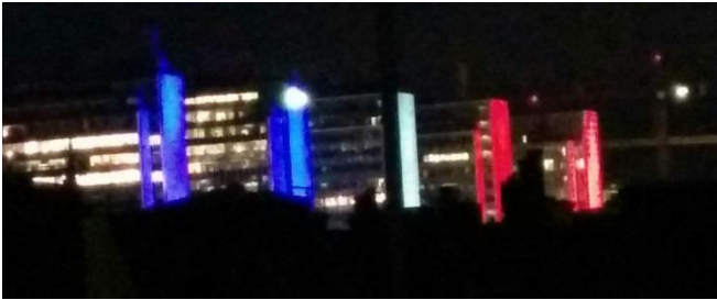
45. Hötorgscity. Hötorgsskrapornas gavlar har fasadbelysning som kan styras i detalj. Fasaderna "vilar" i perioder för att också få mer effekt när de används. Här i franska färger i november 2015.

i ett nattligt mörker. Lättnadsljus kan också vara ett mjukt sätt att belysa detaljer som ger en god helhetsverkan.