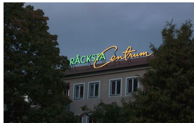
3. Råcksta. Takskyltar är mycket ovanliga i Stockholm och där de förekommer visar de oftast vägen till en större gemensam målpunkt som ett centrum. Eftersom takskyltar är så väl synliga i siluetten ställs särskilt höga krav på allmänt intresse och på utformningen av dem. Denna skylt var vinnare av Lysande skylt 2012.

Ljuset i Stockholm är en unik kvalitet. Skymningen präglar upplevelsen av staden. Det nordliga, kalla klimatet skapar ett himlavalv med stora kvaliteter. Månen och stjärnorna framträder tydligt under dygnets mörka timmar. Den centrala stadens sammanhängande mörka taklandskap bildar en svart siluett. Upplevelsen av den centrala stadens mörka och sammanhållna taklandskap med sparsamt med fönsteröppningar och andra ljuskällor är ett betydelsefullt karaktärsdrag för Stockholm. Skyltningen ska värna och stärka dessa kvaliteter i staden.