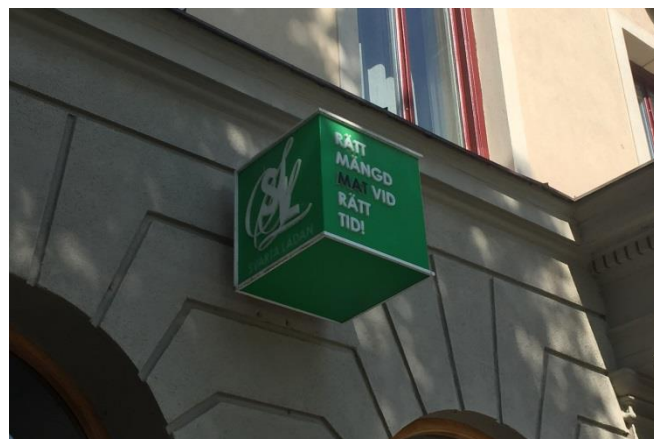
39. Kungsbrogatan. Denna skylt är placerad symmetriskt mellan skyltfönsteröppningarna och inte större än nödvändigt för att inte dominera den detaljerade fasaden.

En nyare sort av volymskapande skylt är kubformade skyltar där budskapet syns från sidorna men även framifrån och uppifrån/nerifrån. För att dessa inte ska bli för dominerande på fasaden är storleken extra viktig att anpassa till omgivningen. Ett riktmärke för vad som brukar fungera är en storlek upp till 60*60*60 cm. Skylten bör inte lysa uppåt då det kan störa eventuella närboende i våningarna ovanför.