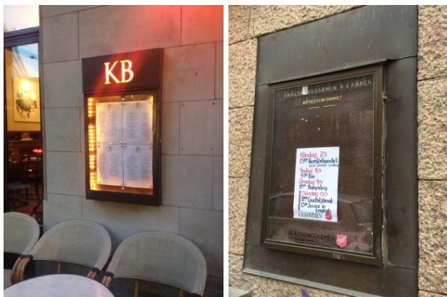
40. 41. Ett utvändigt hängt skyltskåp och ett som är integrerat i fasaden. Höjdmåtten på båda skyltarna är anpassade till fasadens plattindelning och båda har gott om luft till andra fasadelement.