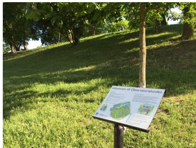
9. Observatorielunden. Skyltar i våra gröna rum ska begränsas till information.

Allmänna reklambudskap ska inte heller förekomma på kulturhistoriskt värdefulla byggnader.