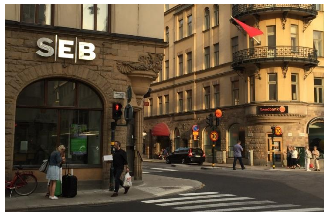
24. Scheelegatan/Hantverkargatan. Här är respektive skylt anpassad till byggnaden den sitter på och ingen dominerar över den andre i stadsmiljön. Inga skyltar där det inte är verksamheter.

Varje plats har sina förutsättningar utifrån placering i staden, storlek, synlighet, historia, mängd och typ av verksamheter och aktiviteter och så vidare.