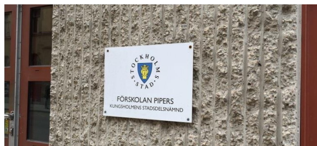
17. Pipersgatan. Exempel på en miniskylt som påverkar fasaden minimalt.

Skyltar mindre än 0,2 kvadratmeter som exempelvis visar en liten verksamhet, vem som äger fastigheten eller gatunummer behöver inte bygglov.