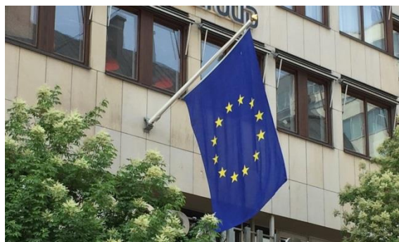
14. Regeringsgatan. Vissa verksamheter, som ambassader och här EU-kommissionens Sverigekontor, visar naturligen sin närvaro med flaggor.

Små flaggor, nationsflaggor, enstaka annan flagga och vimplar behöver inte bygglov. Större flaggor och flera flaggstänger tillsammans med reklam, text, logotyp eller annat budskap behöver bygglov.