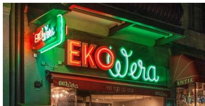
7. Den gamla neonskylten "Sko Vera" har med ett mycket enkelt grepp fått bli skylt för en ny verksamhet på samma plats – "Eko Wera". Utsågs till vinnare av Lysande skylt 2015.

Innovation och nytänkande bidrar till att utveckla Stockholm. Tillfällig skyltning och ljussättning kan användas för att pröva nya lösningar för nutida behov. En del skyltar närmar sig också konsten på ett positivt sätt för en upplevelserik stadsmiljö.