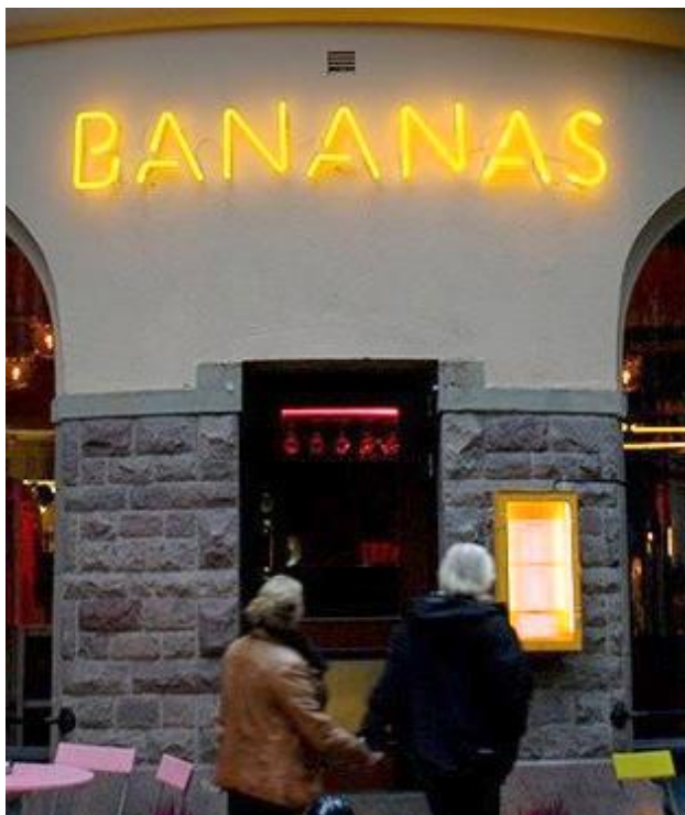
31. Skånegatan. Vinnare av Stockholms skyltpris 2015 med motiveringen "Avväpnande enkelt och ledigt återknyter de gula slingorna för bistro Bananas på Södermalm till neonkonstens lekfulla ungdom."

vackra neonskyltar. De fungerar på i princip alla byggnadstyper och miljöer, med undantag från särskilt värdefulla kulturmiljöer som Gamla stan.