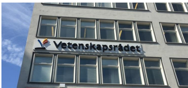
32. Centralplan. Skivans färg är i liknande nyans som den bakomliggande fasaden och skylten är placerad symmetriskt över fönsterpartiet.

En skivskylt i plåt, polykarbonat, glas eller liknande är ganska lätt att anpassa till en byggnad i utformning och storlek. Finns det många detaljer och dekorationer på fasaden kan en annan skylttyp vara att föredra. Det är viktigt att anpassa bakgrundsfärgen och materialet då skylten kan bli bländande vid ljus och/eller blankt material.