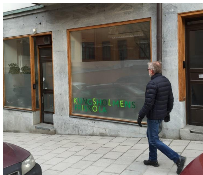
34. Pipersgatan. Folierad skylt som samtidigt fungerar som insynsskydd.

Foliering är oftast enkel att genomföra och kan göras på de flesta fönster. Folieringen kan ibland ha flera funktioner – som skylt och som insynsskydd, för att dölja baksidor på hyllor, som vackert mönster och så vidare. Undvik att foliera hela fönster för att inte bidra till en upplevelsefattig och otrygg stadsmiljö.