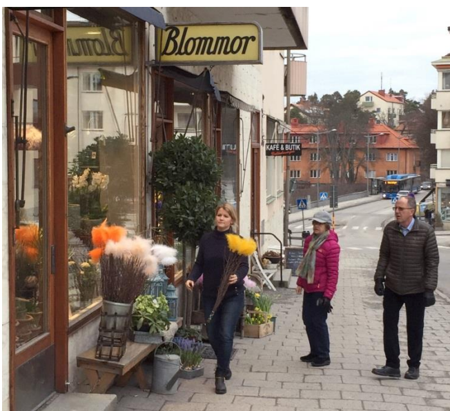
19. Badstrandsvägen. Blommor och andra växter bidrar till en levande stadsmiljö.

Varuskyltning i stadsummet bidrar oftast till en positiv upplevelse i stadsmiljön. Den behöver inte bygglov men upplåtelsestillstånd från stadens trafikkontor.