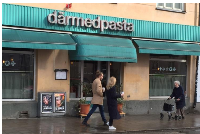
13. Långholmsgatan. Markiserna innehåller ingen reklam, text eller logotyp och behöver därmed inte bygglov.

Markiser som är fällbara och inte innehåller reklam/budskap behöver inte bygglov.