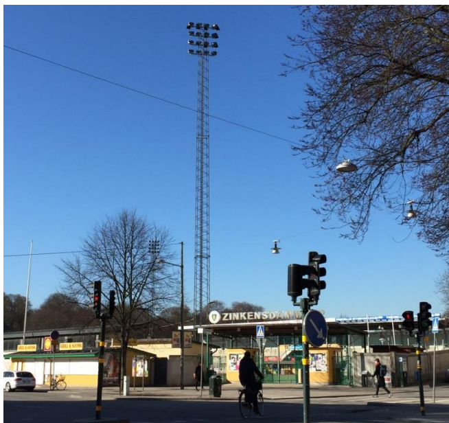
11. Zinkensdamms idrottsplats. Strålkastare påverkar ofta omgivningen med sin kraftiga ljusstyrka. De syns också vida omkring i stads- och landskapsbilden. Stor omsorg behöver därför läggas vid placering, riktning och reglering av ljusstyrka över dygnet.

Fasadbelysning är också en ljusanordning.