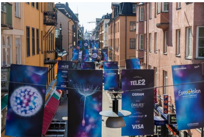
23. Götgatan. ESC-finalen i Stockholm var ett unikt evenemang under en begränsad tid. Skyltar av olika slag specialgjordes för evenemanget. Här linspända skyltar/banderoller.

Vepor med reklam och linspända skyltar är alltid tidsbegränsade då den här typen av skyltar alltid är tillfälliga.