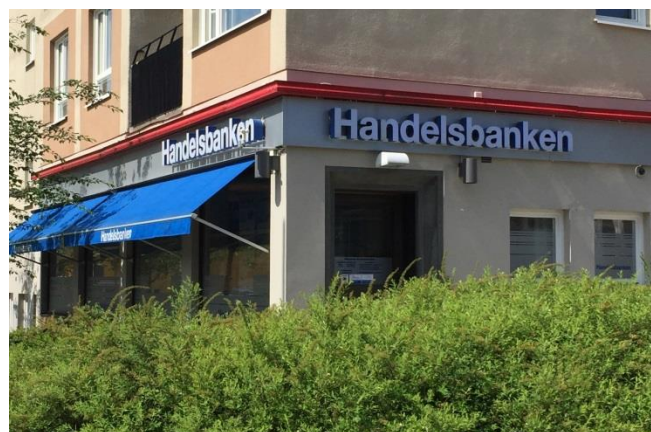
10. Kärrtorp. Skylt för verksamheten över entrén. Den röda ljusslingan (exempel på ljusanordning som behöver bygglov) knyter ihop alla byggnader runt Kärrtorps centrum med verksamheter i – välfunnen enkel lösning i tidstypisk karaktär.