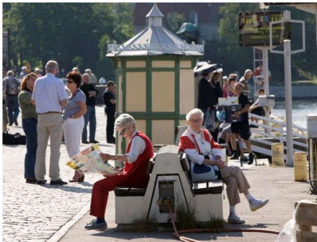
4. Södra Blasieholmshamnen. Vid stadens vatten är det särskilt viktigt att skyltar inte tar plats eller dominerar stads- och landskapsbilden. De skyltar som syns är de som vägleder båttrafikanterna med mål för respektive båtturen och avgångstider

byggnaders skala, stiluttryck, placering och detaljeringsgrad bidrar till en balanserad helhet. Särskild omsorg vid tillägg, som exempelvis skyltar, ska läggas på vattenrummets skönhetsvärden.