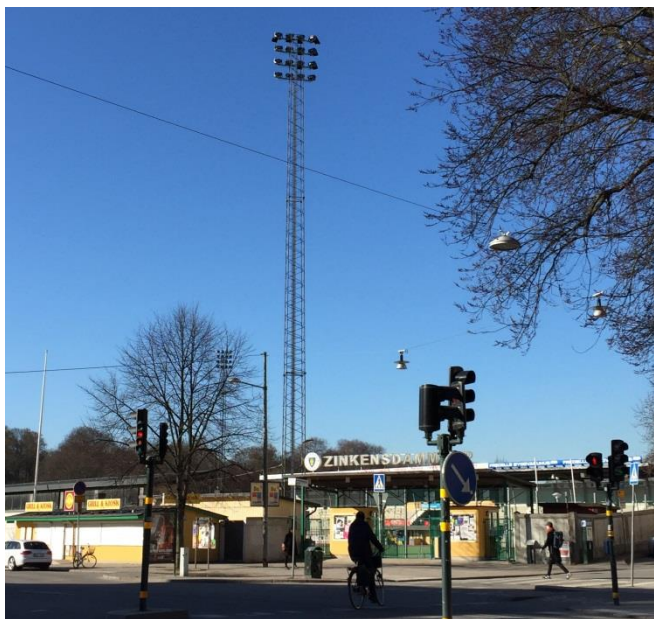
11. Zinkensdamms idrottsplats. Strålkastare påverkar ofta omgivningen med sin kraftiga ljusstyrka. De syns också vida omkring i stads- och landskapsbilden. Stor omsorg behöver därför läggas vid placering, riktning och reglering av ljusstyrka över dygnet.

Fasadbelysning är också en ljusanordning.