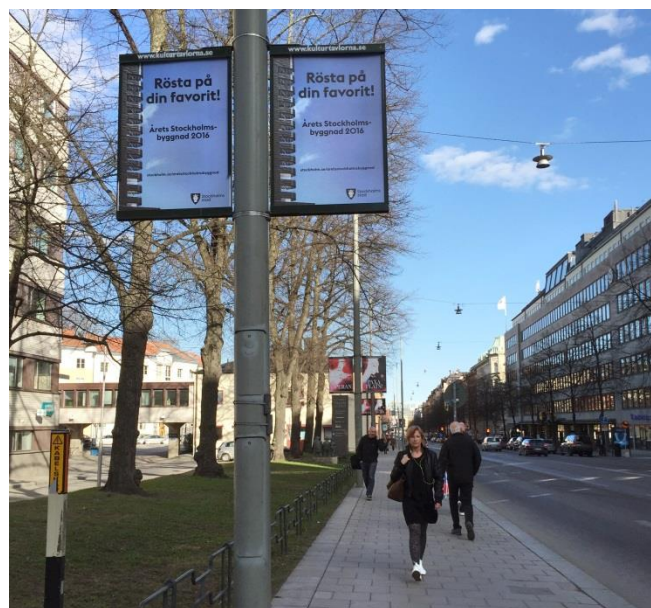
21. Fleminggatan. Information från Stockholms stad och från ett av stadens museer.

Kulturtavlor kallas de mindre, långsmala skyltarna som sitter på lyktstolpar längst med vissa gator i staden. De informerar om angelägna evenemang, kulturhändelser och allmän information från staden. De behöver inte bygglov.