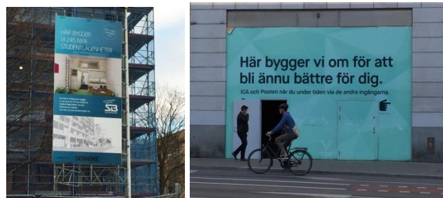
15. Mariebergsgata. Byggplatsskylt på ställning inne på samma fastighet där bygget pågår.

fastighet där bygget pågår. De behöver då inget separat bygglov.