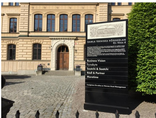
42. Drottninggatan. Kulturhistoriskt värdefulla byggnader kan vara svåra att skylta på, särskilt om många olika verksamheter ska dela på utrymmet. En samlande skylt i platspecifikt utformning för flera verksamheter kan då vara en lösning. //om möjligt hitta bild där skylten är öppen nertill för ökad trygghet//

På några platser, vid vissa byggnader och för särskilt allmänt viktiga verksamheter kan fristående verksamhetsskyltar vara den mest lämpliga skyltningen. Tänk särskilt på att inte skymma utfarter eller siktlinjer i staden. Skylten kan med fördel utformas så att den är öppen längst ner så man ser om någon står bakom – en viktig trygghetsfråga.