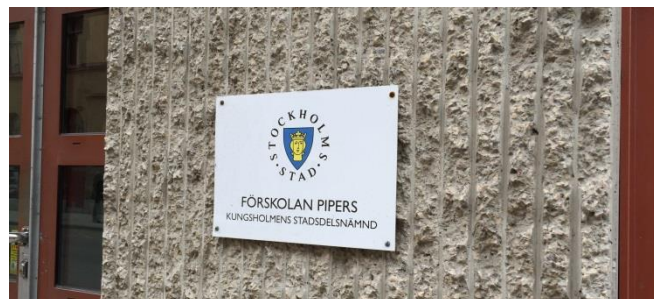
17. Pipersgatan. Exempel på en miniskylt som påverkar fasaden minimalt.

Skyltar mindre än 0,2 kvadratmeter som exempelvis visar en liten verksamhet, vem som äger fastigheten eller gatunummer behöver inte bygglov.