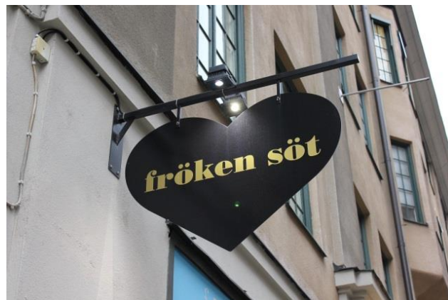
38. Götgatan. Pendelskyltar kan enkelt och relativt billigt göras i personlig form som inte konkurrerar med fasadens dekorationer. Det är denna ett fint exempel på.

För att synas längs med en gata är en pendelskyltar en mycket vanlig lösning. De går oftast enkelt att anpassa till byggnaden. Tänk särskilt på höjden 3,0 meter över gatan för att inte försvåra trottoarstädning, snöskottning etc.