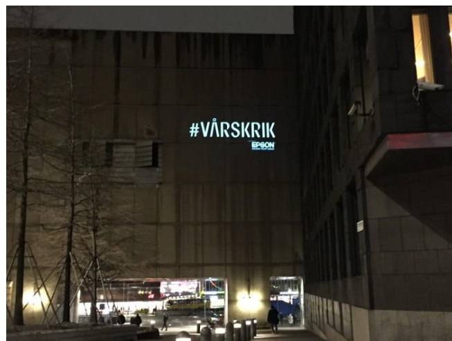
44. Kulturhuset (mot Beridarbansgatan). En tät fasad får ett tillfälligt tillskott med ett lysande budskap utan att plåtfasaden påverkas.

Projicering av ljus på en trottoar eller fasad blir allt vanligare. Projektioner är ett enkelt sätt att få uppmärksamhet utan att göra åverkan på markbeläggning eller fasad. Speciellt synlig blir dessa sorters skyltar förstas under de mörka vintermånaderna. Projektioner kan dock störa gående, närboende och/eller trafik och man behöver därför vara särskilt noga när man riktar ljuset.