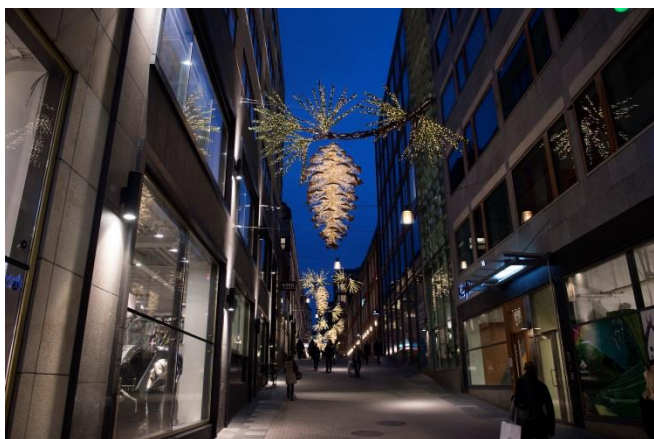
22. Jakobsgatan. Här är gaturummet dekorerat under december och januari.

Stämningsbelysning under advent, jul- och nyårshelgerna behöver inte bygglov.