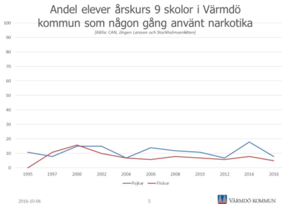
Figur 1: Andel elever av de som går i årskurs 9 i kommunal eller fristående skola i Värmdö kommun som angett att de någon gång använt narkotika

Andelen flickor som någon gång använt narkotika var lägst 2016 5 procent. Högst var andelen år 2000, 16 procent. Av enkätsvaren går det inte att utläsa vare sig en ökning eller minskning av narkotikaanvändningen under de senaste 20 åren. De förändringar som finns mellan olika mättillfällen är mer tillfälliga (CAN, Jörgen Larsson, Stockholmsenkäten 1992-2014).