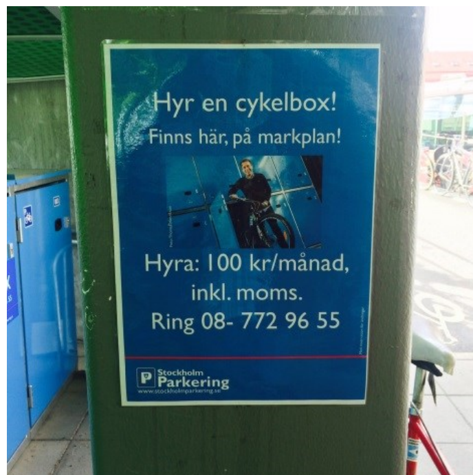
Information från Stockholm parkering

Idag är Älvsjö C cykelgarage en väl frekventerad uppställningsplats för cyklar. Inte mindre än 350 cyklister ställer dagligen sina cyklar i garaget som är öppet dygnet runt. Att parkera sin cykel i cykelgaraget är idag avgiftsfritt och garaget är öppet för alla. Om efterfrågan av cykelboxar ökar markant kan plan 2 inredas som låst cykelgarage och utrustas för ett kontrollerat inträde med månadskort.