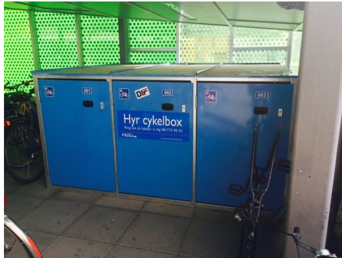
Cykelbox med information