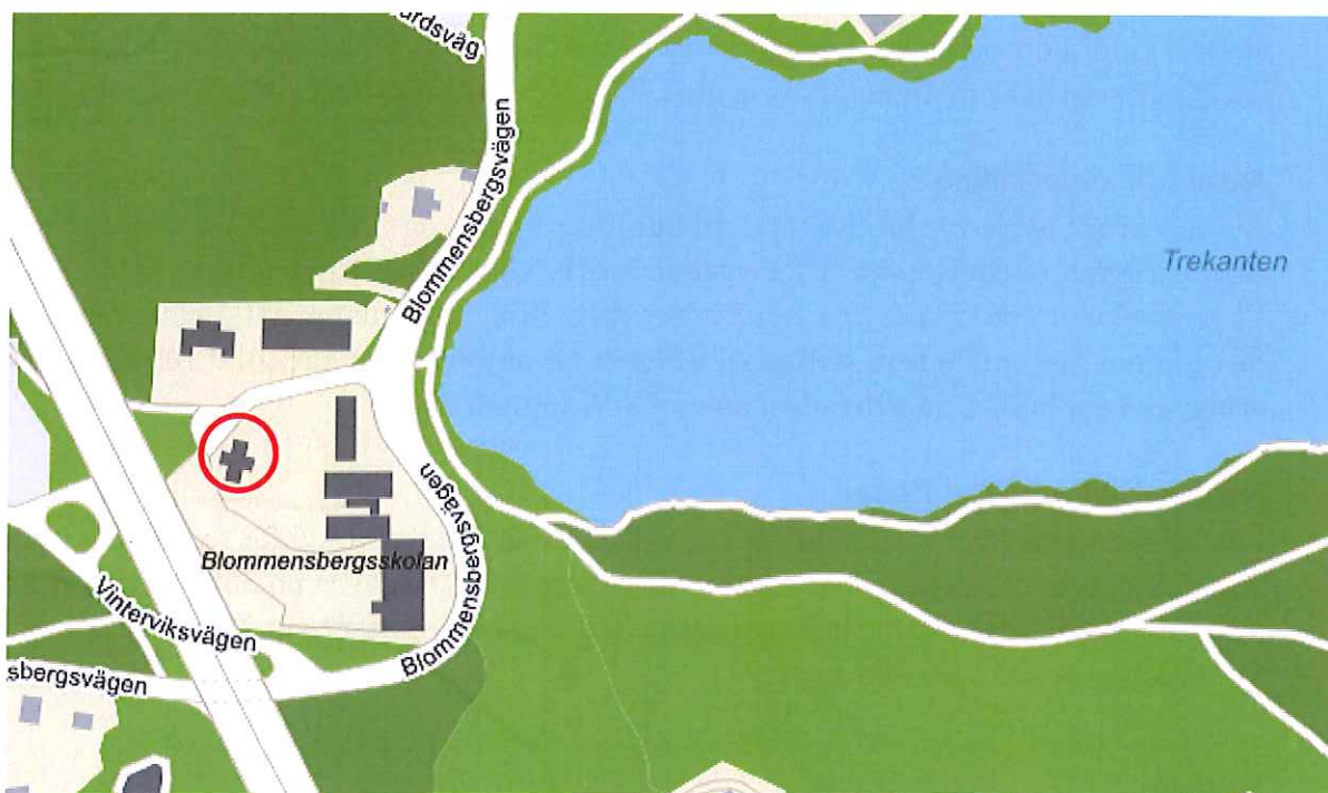
Situationskarta – Blommensbergsskolan, objektet i ringen.

Förvärvet ska ses som ett led i att stärka stadens rådighet över Blommensbergsskolan.