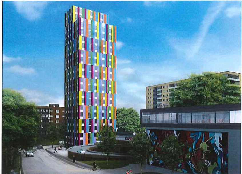
Bild 3. Perspektivskissen i förslaget visar i stora drag projektets utformning. Det nya höghuset är inritat till vänster och handelsutbyggnaden visas till höger i bild.

Exploateringsens innehåll och utformning kommer att prövas i planprocessen.