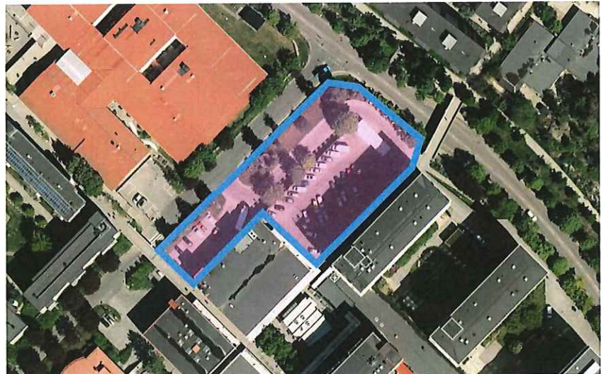
Bild 1. Flygfoto med markanvisningsområdet strax norr om Husby centrum.

Det anvisade området ligger strax norr om Husby centrum längs Trondheimsgatan och inrymmer idag bland annat ett parkeringsdäck i tre våningar inkl. en påfartsramp. Bolaget planerar att riva en del av parkeringsdäcket och bygga ett bostadshus om cirka 19 våningar. Den del av Stadens fastighet Akalla 4:1 som berörs är en mindre markparkering som idag är planlagd som allmän gata. Parkeringen avses istället planläggas som kvartersmark för att kunna utveckla befintlig handel och förbättra miljön runt varuintaget.