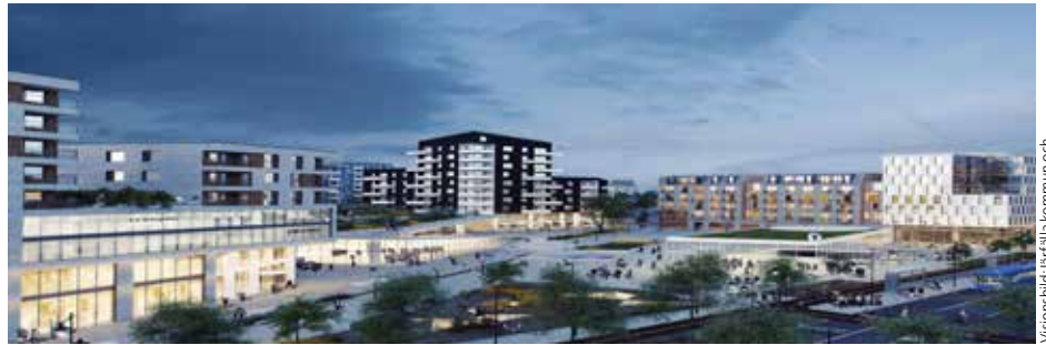
Visionsbild över den framtida Barkarbystaden med tunnelbanan mitt i staden.

– Planen är att en av tunnelbanans uppgångar ska komma upp vid pendeltågets västra plattformände intill den