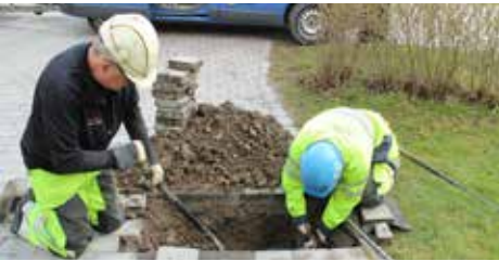
Här pågår installation av mättrör i en bergvärmebrunn intill Barkarby station.