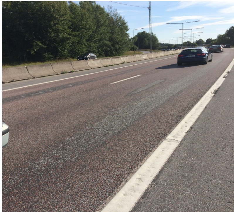
Exempel på sliten beläggning med sprickor och hjulspårslitage. (Ulvsundavägen)

Dessa vägar är mycket högtrafikerade med hög belastning från såväl personbilar som tunga fordon vilket gör att vägen slits ner fort. Temperatursvängningar under de senaste vintrarna har påskyndat slitaget. Antal inkomna skadeanspråk till trafikkontoret angående akuta skador i form av hålbildning i asfalten efter vintern ökar i takt med förslitningsskador.