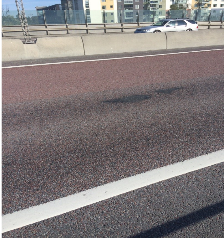
Ex på potthålslagning (Ulvsundavägen)