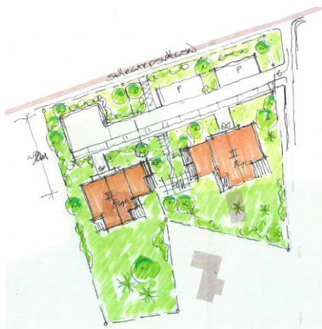
Karta 2: Ansökan om två flerbostadshus i tre våningar söder om Skärgårdsvägen/väg 222