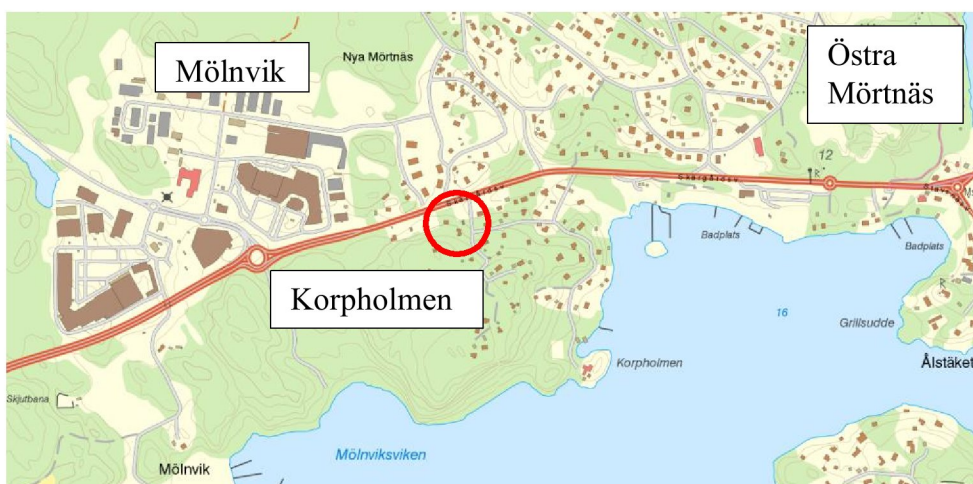
Karta 1: Ansökan avser fastigheter i PFO-området Korpholmen öster om Mölnvik.

Ansökan om planbesked omfattar 16 lägenheter i två flerbostadshus i tre våningar på fastigheterna Mörtnäs 1:544 och 1:131. Fastigheterna ligger i norra delen av Korpholmen, strax söder om Skärgårdsvägen/väg 222 i den västra delen av Grisslingeran.