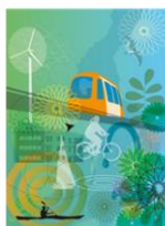
Diskutera en fråga -Fokusgrupp