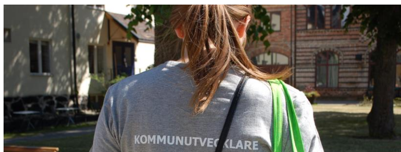
Ungdom som fått jobbet.

Ung i Värmdö – Kommunutvecklarna är ett projekt som genomsyras av de ungas idéer och engagemang. Ung i Värmdö – Kommunutvecklarna är både ett sommarjobb och en metod för ungas delaktighet och inflytande i kommunen. Sommaren 2016 var första sommaren för konceptet Kommunutvecklarna.