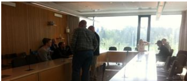
Elever i diskussion med politiker kring rollspelets investeringsbudget

Sedan 2010 har alla Värmdö skolors klasser i årskurs åtta bjudits in till demokratirollspellet Kom till kommunen. Kom till kommunen är ett rollspel där