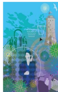
Referensgrupp/råd/ remissinstans - Utvecklingsarbete under längre period

Syfte: ta tillvara ungas kunskaper och erfarenheter i särskilda frågor, lyssna på unga och skapa tillit till demokratiska processer