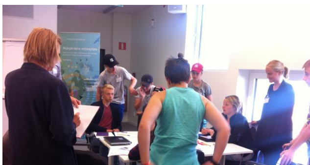
Unga medverkande i ÅVS Ingarökrysset

När kommunen samlar in underlag inför beslut är det särskilt viktigt att ta in ungas kunskaper och erfarenheter. Vid särskilda projekt genomförs olika typer av medborgardialoger. Till medborgardialoger bjuds föreningar, boende, representanter från näringsliv/handlare, representanter från trafikförvaltningen och andra in till dialog. Vid fler av dessa dialoger har inte unga bjudits in. Det är möjligt att formen för dialogerna inte är anpassade så att unga känner sig inbjudna. För att öka ungas delaktighet och inflytande i kommunala beslutsprocesser är det viktigt att bjuda in gruppen ungdomar speciellt. För att fatta bra beslut är det viktigt att lyssna på en mångfald av kommunens medborgare och då även unga medborgare.