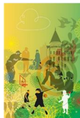
Djupdyk i en fråga -Hel/halvdags dialog