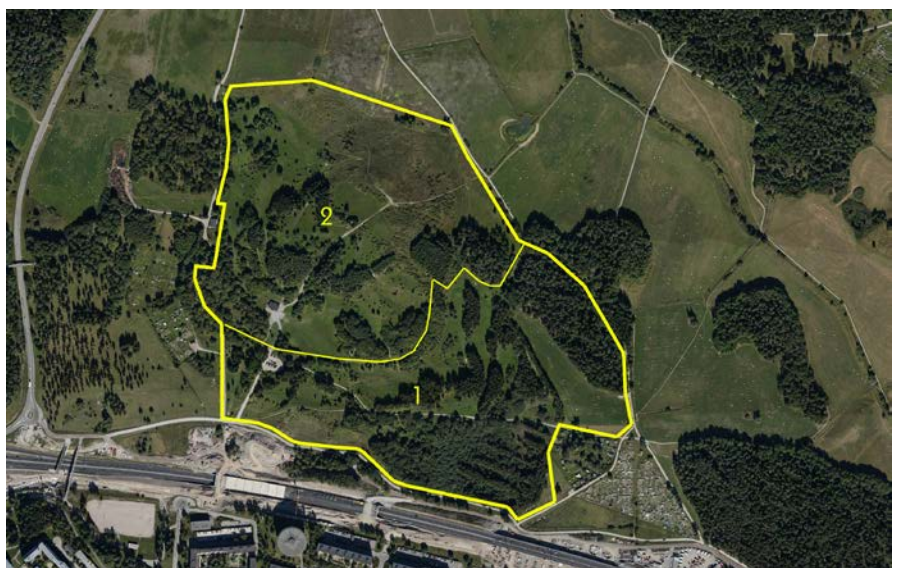
Planområdet med föreslagen etappindelning.

Inom kvartersmark beräknas anläggning av gravkvarter för totalt ca 20 000 gravar, varav ca 9 000 kistgravar. Begravningsplatsen ska byggas ut i etapper, allt eftersom behov uppstår. Den första etappen ska ha tillräcklig storlek för att ge fullgod service för en tidsperiod av minst 10 år. Första etappen utgöra av den sydöstra delen av planområdet och andra av den nordvästra.