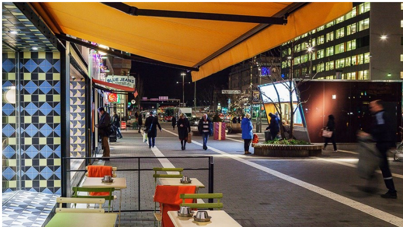
Exempel på variation: Hornstull.