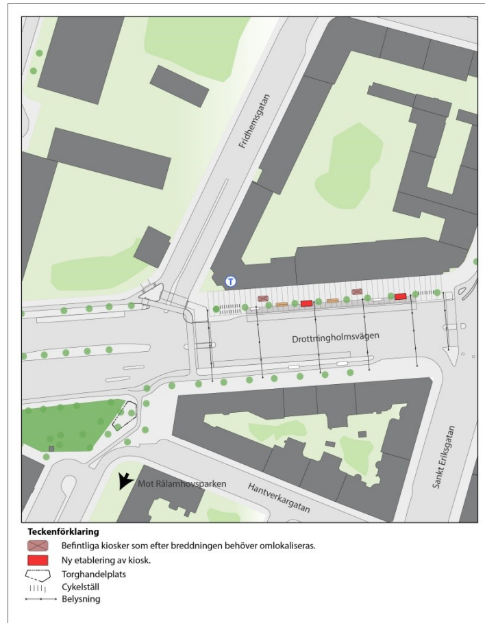
Figur 2. Kartskiss över placeringen av kiosker enligt alt 1

Kioskerna etableras i möbleringszonen mellan träden. Stråk och vistelseytor för gående påverkas negativt jämfört med den lösning som presenterades i inriktningsbeslutet, eftersom återplaceringen av kiosken på gångbanan innebär att ytan för fotgängare blir minskad.