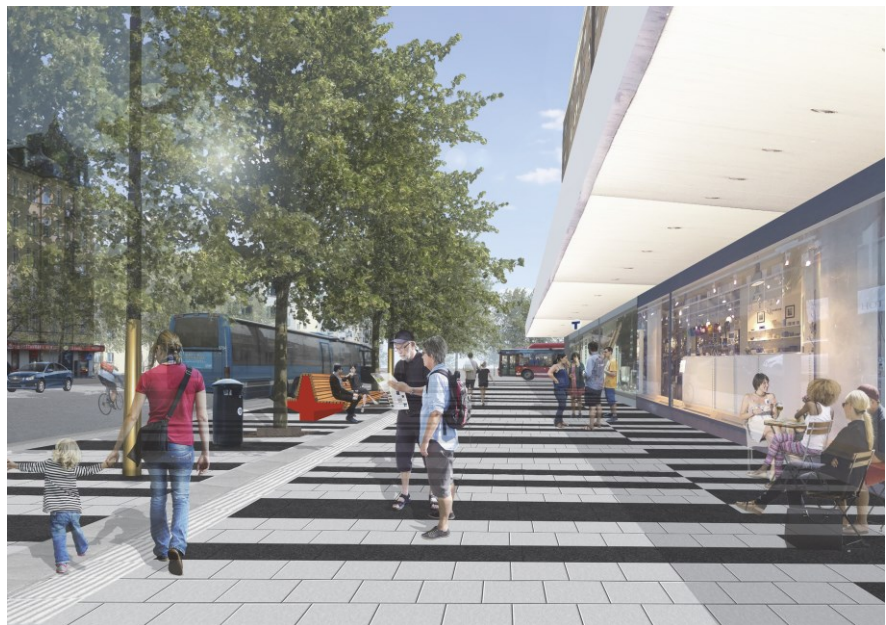
Figur 4. Visionsbild över trottoaren vid kv Väktaren

Vid Fridhemsgatan 18 kan verksamhetsutövarna, om önskemål finns, ges plats för ordnad uteservering. Denna möjlighet kommer inte att finnas om verksamheterna stannar kvar vid kv Väktaren.