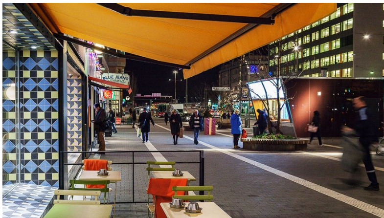
Exempel på variation: Hornstull.