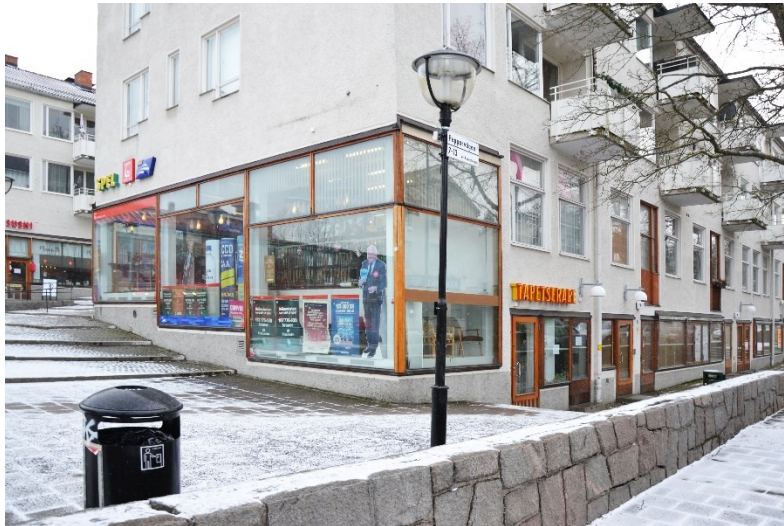
Exempel på öppna fasader: Hökarängen.