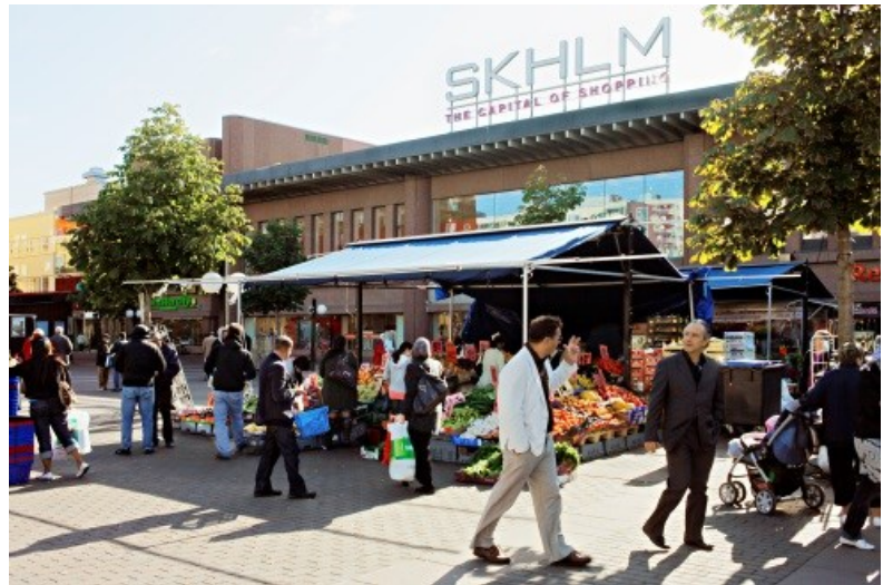
Exempel på tillfälliga aktiviteter: Skärholmen.