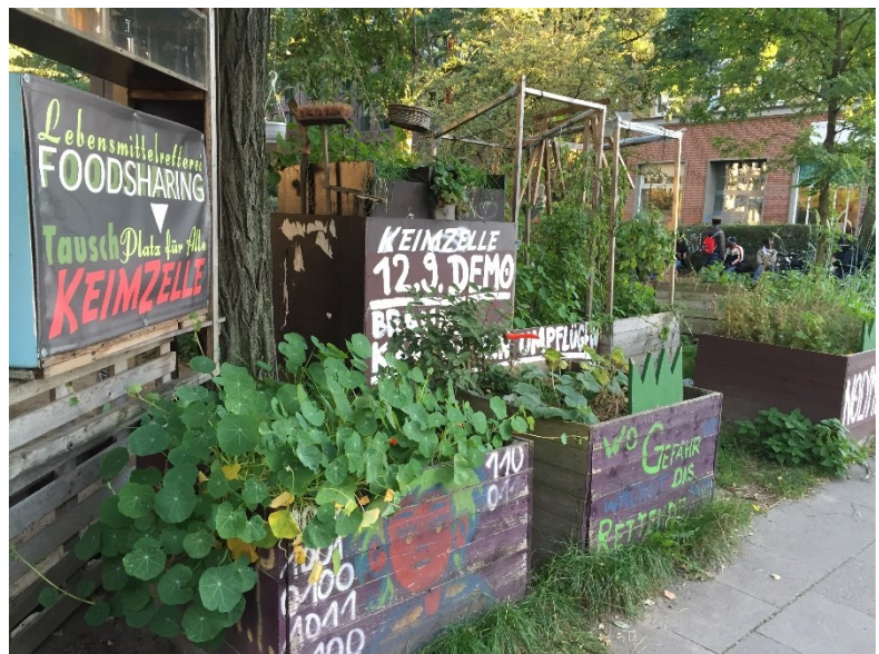
Exempel på medborgarinitiativ: Stadsodling i Hamburg.