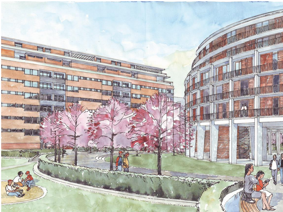
Vy från innergården.