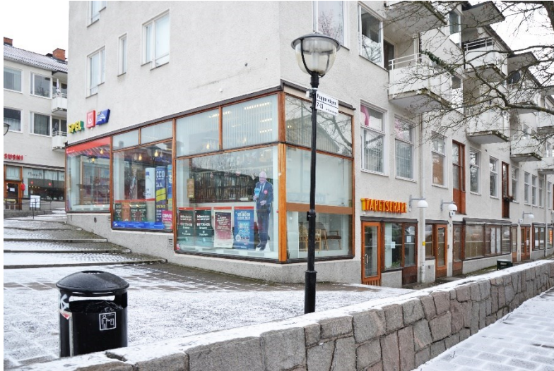
Exempel på öppna fasader: Hökarängen.