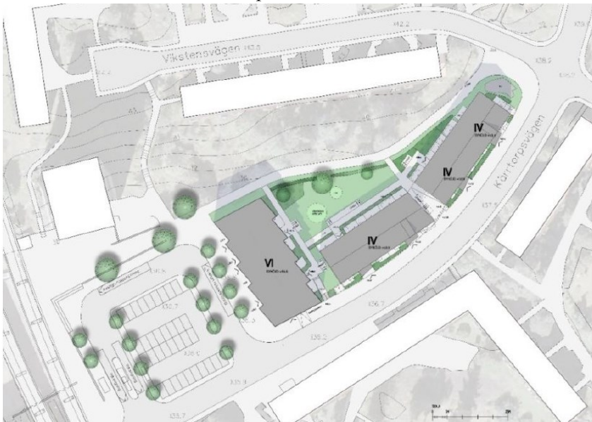
Karta: Föreslagen utformning för Näskubben 2 och delar av fastigheterna Kärrtorp 1:1 och Kärrtorp 1:4.