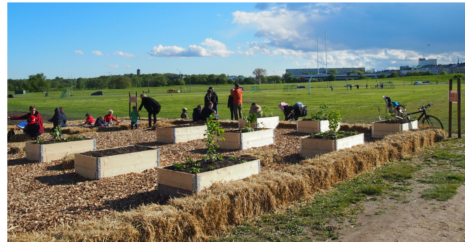
Park under uppbyggnad med hjälp från stora och små