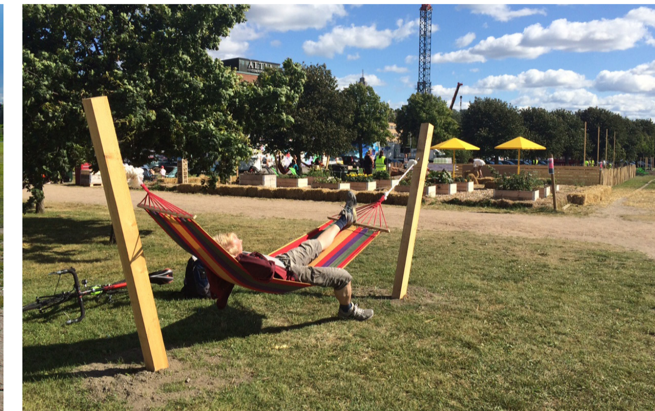
En lugn stund