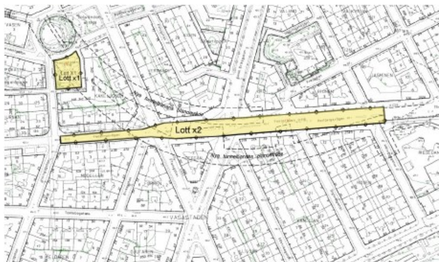
Bild: Tunnelbanans läge under jord.

Om en 3D fastighetsbildning skulle tillåtas för tunnelbanan kan det inte uteslutas att fastighetsägarens vetorätt innebär ett hinder som försvårar markanvändningen ovanför. Stockholms stad vill försäkra sig om fortsatt rådighet som huvudman för allmänna platser, park och gatumark. Staden vill också säkerställa möjligheten att genomföra underjordiska infrastrukturprojekt, med ledningar för bl.a. kraftöverföring och avlopp. Detta sker genom en detaljplaneändring som inte möjliggör 3D-fastighetsbildning inom dessa områden. Tunnelbanan föreslår i stället få servitutlösningar, såsom varit vanligt tidigare.