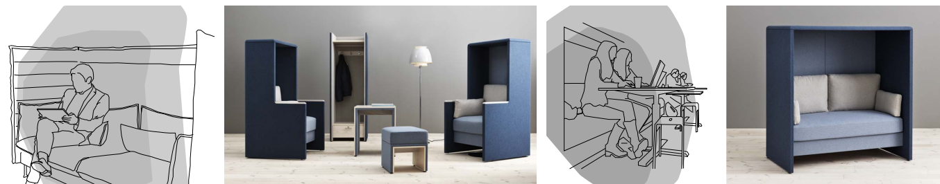
Referensbilder på möbler som indelar kontorslandskap. Dessa möbler förbättrar samtidigt rumsakustiken.