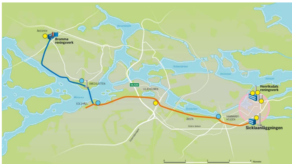
Figur 1: Huvudsaklig tunnelsträckning

Den tunnel som byggs för att överföra avloppsvatten från Bromma och Eolshäll till Sickla kommer att utföras med en tvärsnittsytta om ca 20 m 2 . Tunneln blir ca 14 km lång och kommer att brytas med konventionell teknik. Att använda konventionell teknik blir billigast och medger en relativt kort byggperiod. Figur 1 visar huvudsaklig tunnelsträckning.