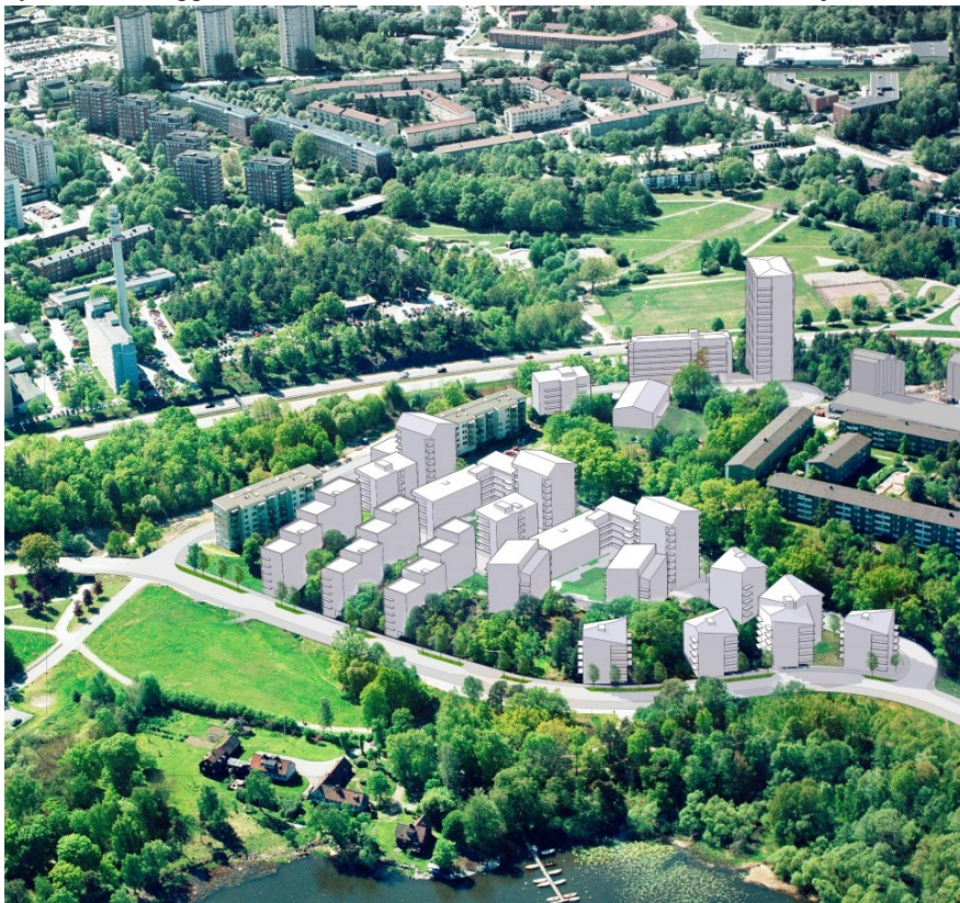
Volymskiss av planförslaget. Vy från nordväst.

Flertalet lägenheter upplåts med hyresrätt (cirka 215 student-lägenheter och 375 hyreslägenheter varav ett LSS-boende och ett stort antal ungdomsbostäder). De terrasserade lamellhusen upplåts som bostadsrätter (cirka 110 lägenheter). Marken för hyresrätterna upplåts med tomträtt. Marken för bostadsrätterna ska säljas.