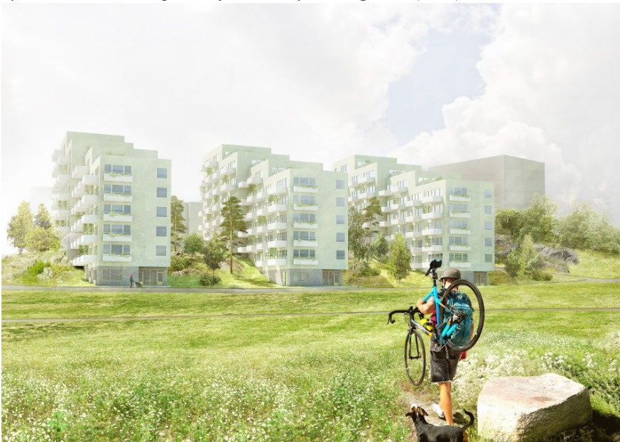
Terrasserade lamellhus, vy från öster (Joliark)