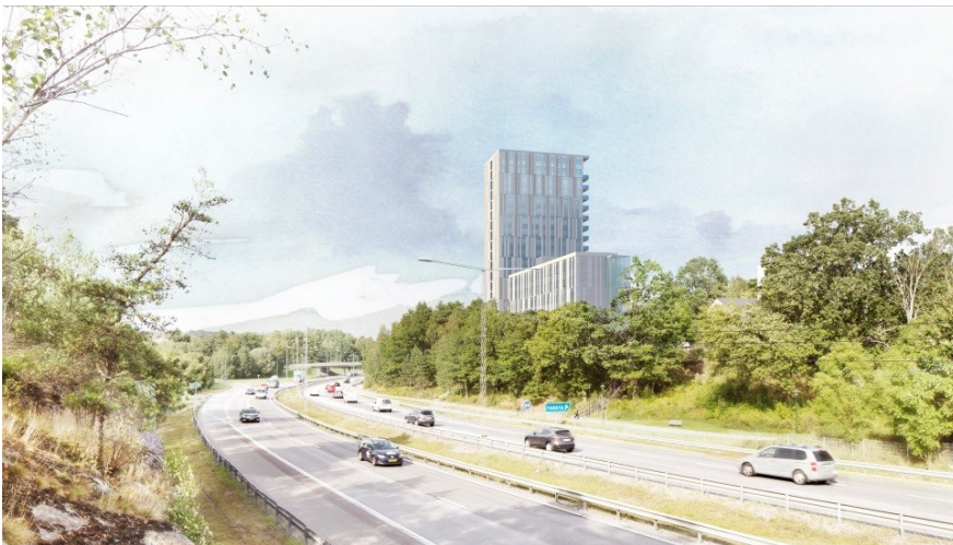
Studentområdet vid Nynäsvägen. Vy från söder. (White)