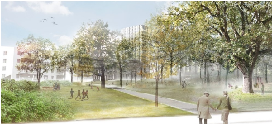
Vy över den centrala parken från den nya lokalgatan (Land)