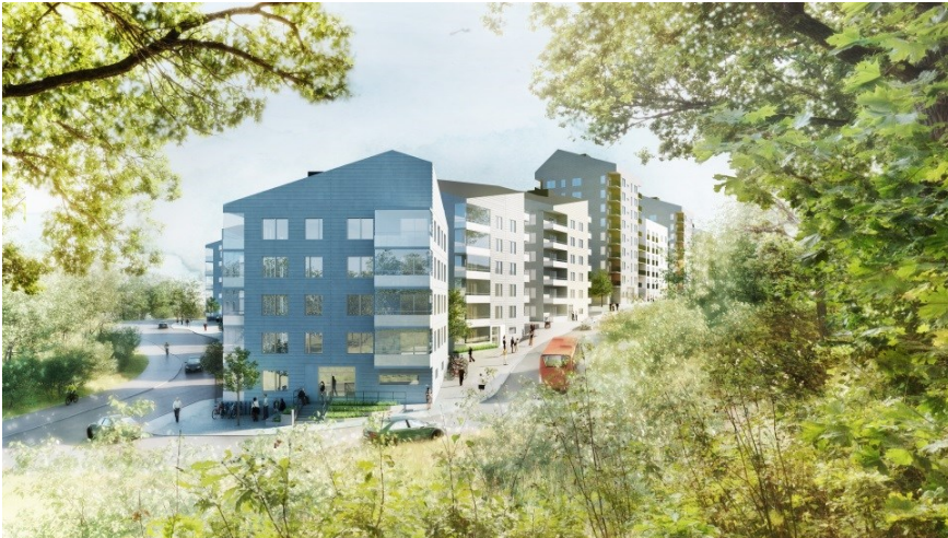
Norra bebyggelsen, vy från norr (White)