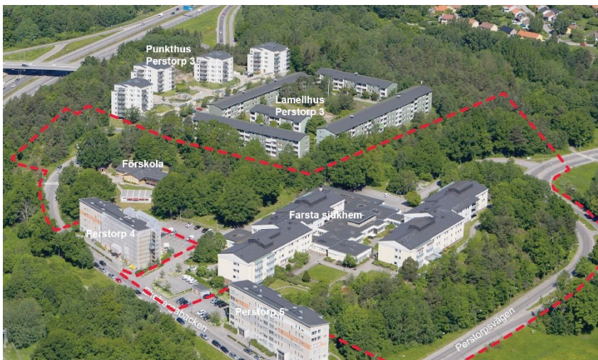
Snedbild med planområdet markerat med röd streckad linje