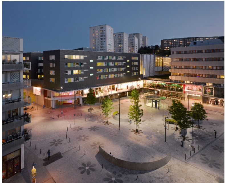
Exempel på god överblickbarhet: Liljeholmstorget.