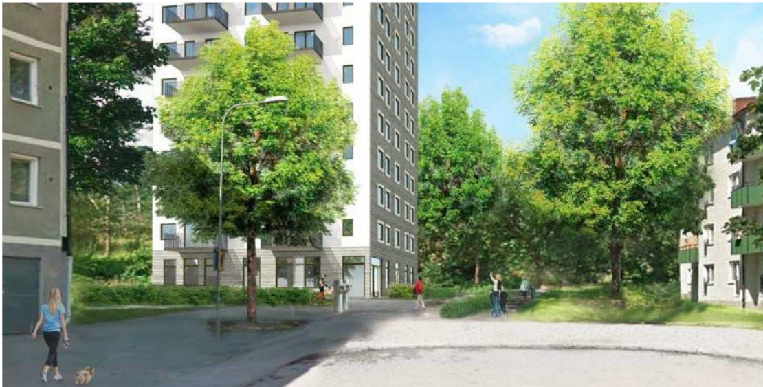
Illustration: Vy mot nordväst med bottenvåning och entré till parken (Bergkrantz arkitekter)