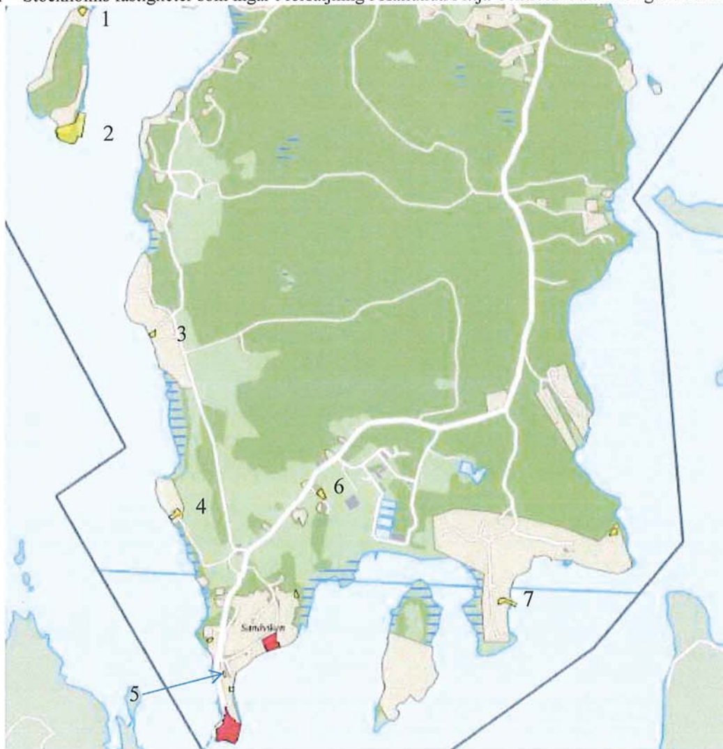
Figur 2 – Stockholms fastigheter som ingår i försäljning på Näslandet markerat i gult och siffra. Skala 1:26 000