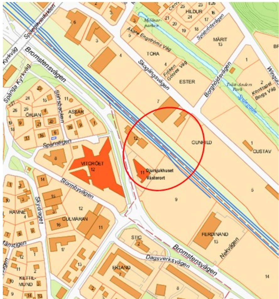
Bild 3. Läge för ny gång- och cykeltunnel.

m lång och ramperna är 100 m långa på södra sidan och 70 m långa på norra sidan. Bredden på trägen varierar mellan ca 9 m och 30 m.