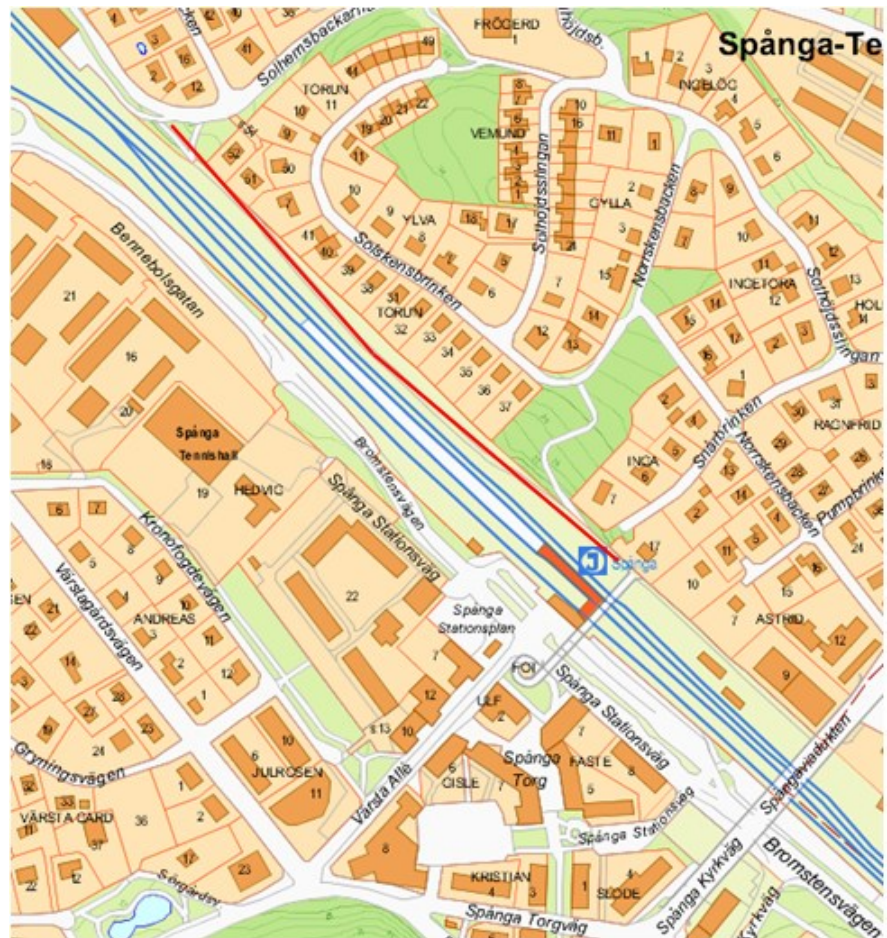
Bild 2. Gång- och cykelväg mellan Solhemsbackarna och Spånga station, se rött streck för gång- och cykelvägens sträckning.

regleras samlat med andra mellanhavanden mellan parterna i genomförandeavtalet. Staden ansvarar för och bekostar projektering och utförande av belysningsanläggningar för gc-vägar, samt viss erforderlig markåtkomst för gc-vägar, vilket totalt beräknas uppgå till ca 3 mnkr.