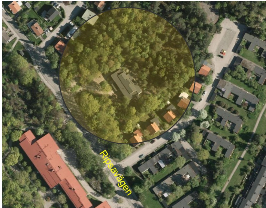
Figur 1. Befintlig förskola på Ripsavägen 33.