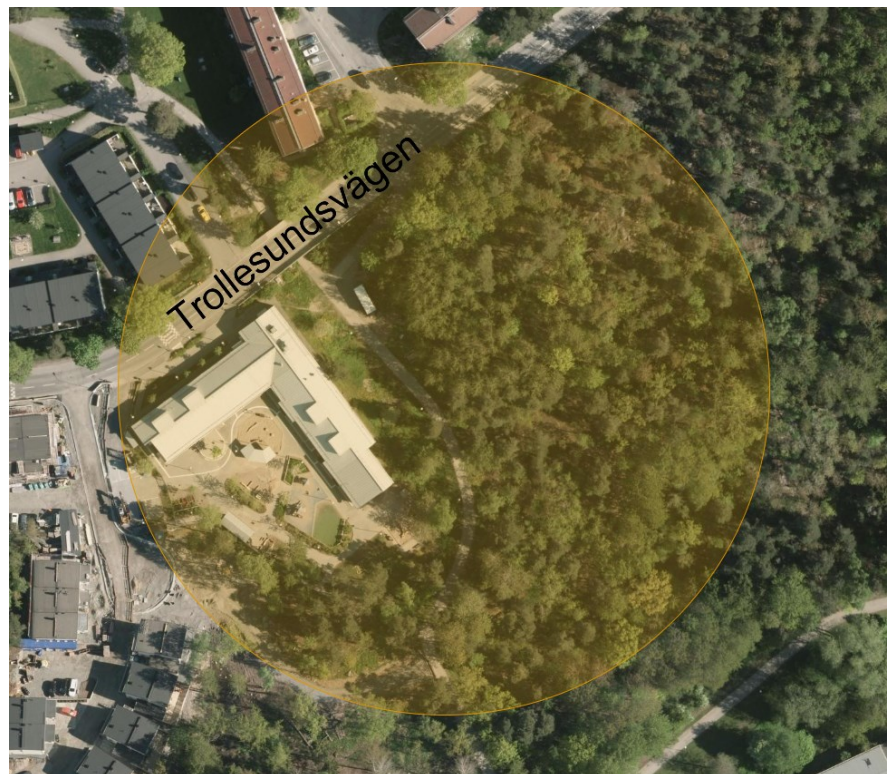
Figur 1. Området utmed Trollesundsvägen som innefattar Skolfilmen 1 samt den del av Trollesundsskogen som kan vara lämplig för en ny förskola.

Förvaltningen föreslår samtidigt att man utreder möjligheterna att bygga en förskola på åtta avdelningar bredvid Skolfilmen 1 i Trollesundsskogen. Genom att behandla dessa två projekt inom samma detaljplaneärende kan man spara både ekonomiska såväl som tidmässiga resurser, samtidigt som man möjliggör en gemensam bemanning från stadens olika förvaltningar och bolag.