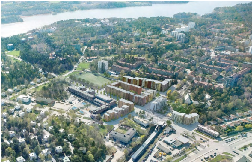
Flygperspektiv på ny bebyggelse i etapp 1.

Pga. de omfattande anläggningsarbetena för etapp 1 måste stadens markarbeten färdigställas innan byggherrarna kan få tillträde till sina respektive kvarter. Gatorna får ett tillfälligt ytskikt innan byggherrarna tillträder för att sedan färdigställas med permanenta ytskikt, kantstenar, träd, möblering etc när de respektive kvarteren är färdiga för inflyttning.