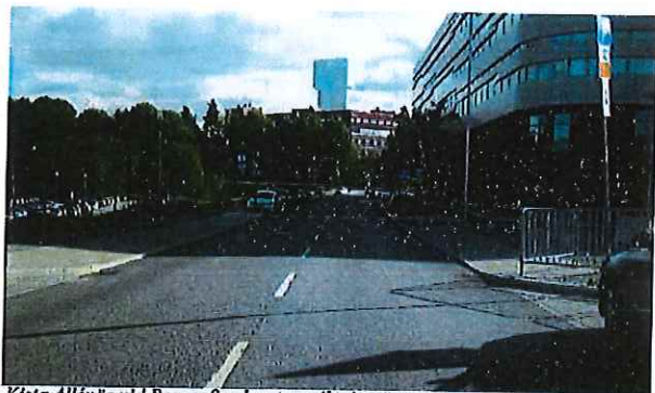
Kista Alléväg vid Borgarfjordsgatan, riktning österut

Gata med två körfält i vardera riktning samt med kantstensparkering på båda sidor. Indragen kontorsbebyggelse kantar gatan. Cykelbana/-väg finns utmed gatan. Buss trafikerar sträckan.