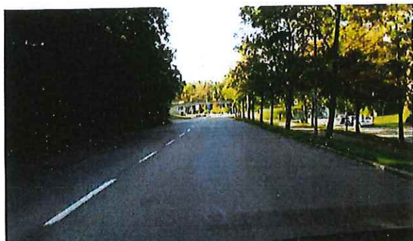
Norgegatan vid Stavangergatan, riktning söderut

Gatan är separerad från gång- och cykelvägen som går i ett plan ovanför. Upptrampade stigar längs gatan visar dock att gångtrafik förekommer utmed gatan. Bebyggelse finns längs sträckan, dock huvudsakligen med entréer mot gång- och cykelvägen. Buss trafikerar gatan.