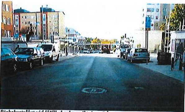
Rinkebystråket vid Hällbybacken, riktning söderut

Norr om Skråbygränd kantas gatan av restauranger och butiker. Här sker cykling i blandtrafik. Söder om Skråbygränd sker gång- och cykeltrafik i ett högre plan. Där är bebyggelsen indragen och entréerna vända bort från gatan. Gatan utgör ett pendlingsstråk för cyklister och buss trafikerar gatan.