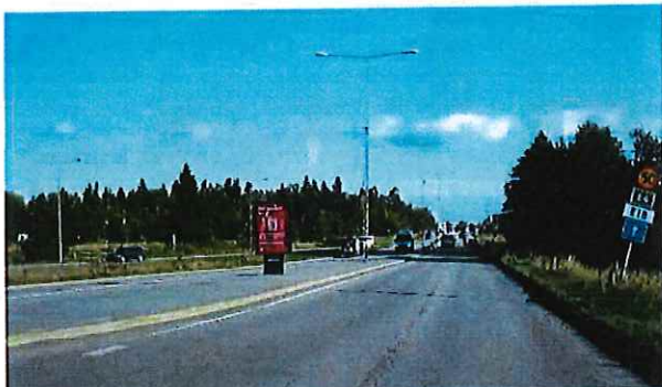
Akallalänken vid Norrviksvägen, riktning norrut

Väg med två körfält i vardera riktning där biltrafiken är helt separerad från gång- och cykelnät. Cykelbana finns utanför transportrummet och är utpekad som pendlingsstråk. Buss trafikerar sträckan. Oskyddade trafikanter korsar vägen vid planskilda korsningar.