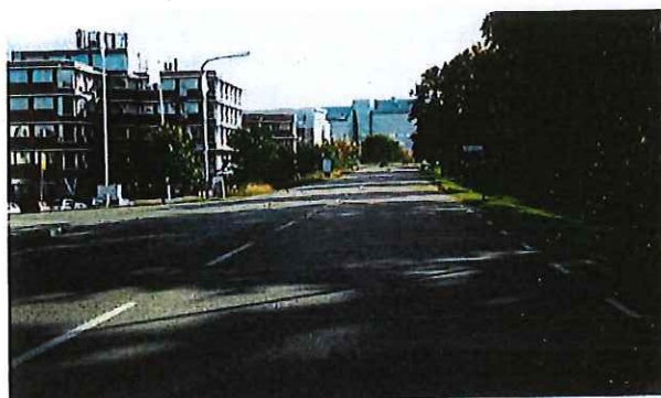
Finlandsgatan vid Vandavägen, riktning österut

Gata som kantas av kontorsbebyggelse och grönområden. Gång- och cykelväg är indragen från gatan. Det är möjligt att passera gatan både planskilt och på övergångsställen. Buss trafikerar gatan. Kantstensparkering på västra delen av gatan kan behöva utredas vid införande av ny hastighetsgräns.