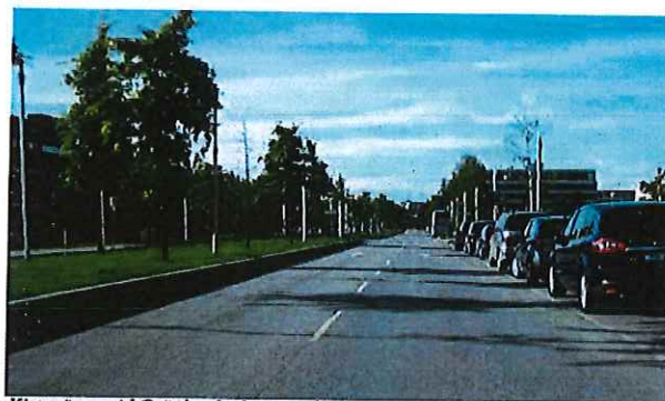
Kistavägen vid Grönlandsgången, riktning västerut