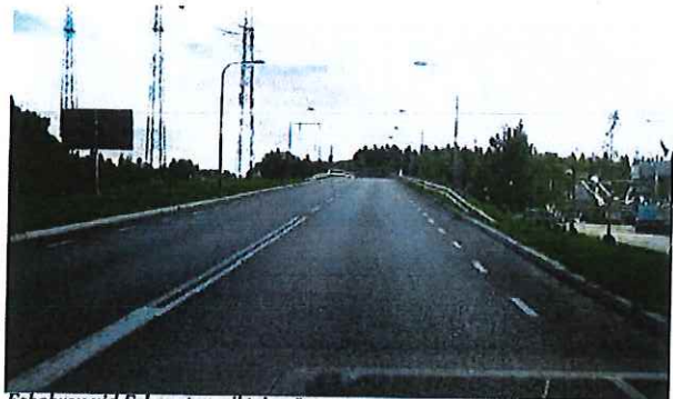
Esbobron vid Esbogatan, riktning österut

Väg helt separerad från gång- och cykeltrafik.