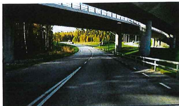
Torshamnsgatan vid E18, riktning västerut