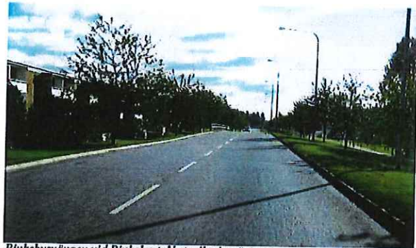
Rinkebysvängen vid Rinkebystråket, riktning österut

Gata med indragen bostadsbebyggelse på ena sidan och grönområde i ett lägre plan på den andra där gång- och cykelvägen ligger. Cykelstråket är ett pendlingsstråk på delar av sträckan. Buss trafikerar delar av gatan.