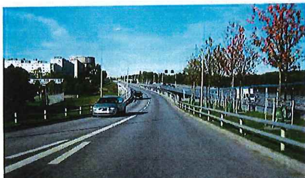
Hjulstavägen vid Tenstastråket, riktning västerut

Vägen är ett transportrum parallellt med E18. Ingen gång- och cykeltrafik i gaturummet.