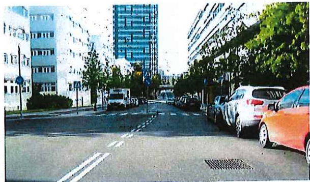
Borgarfjordsgatan vid Kista Alléväg, riktning västerut

Gatan kantas av kontorsbebyggelse. Cykelbana finns utmed hela sträckan. Buss trafikerar delar av sträckan.