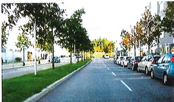
Skagaffordsgatan vid Hanstavägen, riktning norrut

Gatan fungerar som på och avfart till E18/E4. Gång- och cykelbana finns separat längs gatan. Övergångsställen finns där gående och cyklister kan passera. Stadsbuss trafikerar gatan.