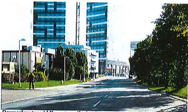
Danmarksgatan vid Fyngatan, riktning österut

Gata med tunnelbanan på ena sidan och kontorsbebyggelse samt Kista galleria på den andra. Gångbana och dubbelriktad cykelbana på ena sidan av gatan. Bussar trafikerar sträckan.