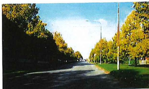
Rinkeby Allé vid Rinkebysvägen, riktning västerut

Gatan är separerad från gång- och cykelvägen som går i ett plan ovanför. Upptrampade stigar längs gatan visar dock att gångtrafik förekommer utmed gatan. Bebyggelse utmed sträckan, dock huvudsakligen med entréer mot gång- och cykelvägen. Buss trafikerar delar gatan.