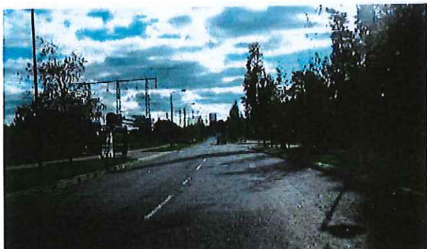
Esbogatan vid Kronåsvägen, riktning österut

Gata med separat gång- och cykelväg som är ett pendlingsstråk för cyklister. Gatan kantas av grönområden och större kontor och industriverksamheter. Buss trafikerar sträckan.