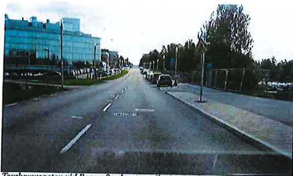
Torshamnsgatan vid Borgarfjordsgatan, riktning österut

Vägen har motorvägsstandard och bebyggelsen längs väggen är indragen och riktad från vägen. Gång- och cykeltrafik sker utanför gaturummet. Stadsbuss trafikerar gatan.