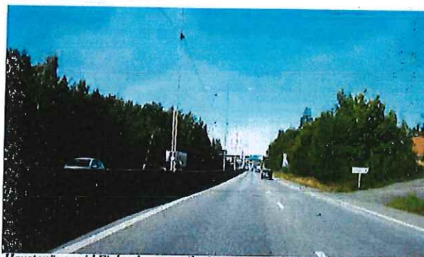
Hanstavägen vid Finlandsgatan, riktning västerut

Gata med två körfält i vardera riktning där gående och cyklister inte vistas i gaturummet väster om Turebergsleden. Öster om Turebergsleden sker cykling på dubbelriktad cykelbana. Sträckan är ett utpekat pendlingsstråk för cyklister. Öster om Oddegatan ändras gatans karaktär vid två kvarter där den kantas av bostäder. I övrigt kantas Hanstavägen av grönområden och kontorsbebyggelse. Större delen av bebyggelsen vänder sig dock bort från gatan. Buss trafikerar sträckan.