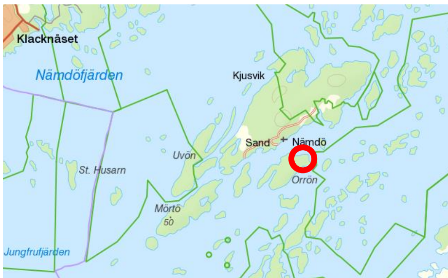
Översiktskarta. Planområdet ligger på nordöstra sidan av Orrön.

Planområdet ligger på nordöstra sidan av Orrön i Nämdö skärgård. Planområdets areal är ca 33 500 m 2 varav ca 13 000 m 2 är vattenområde. Planområdet planläggs som kvartersmark bostäder och som vattenområde.