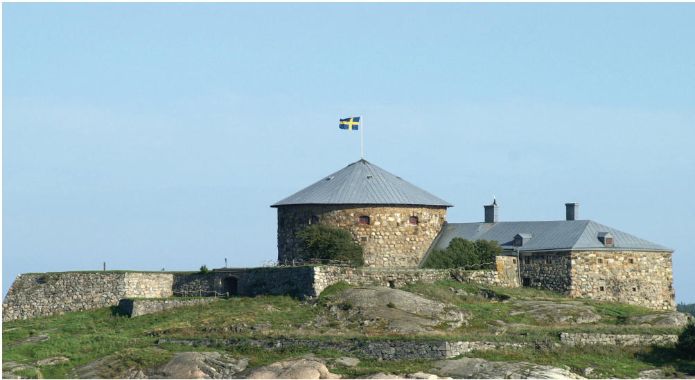
Dalarö skans, Haninge kommun

SÖDERTÖRNS MILJÖ- & HÄLSO- SKYDDSFÖRBUND