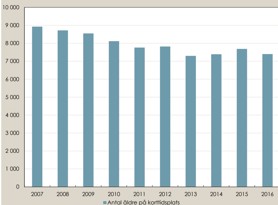
Figur 2. Antal personer på korttidsplats, oktober 2007 till 2016