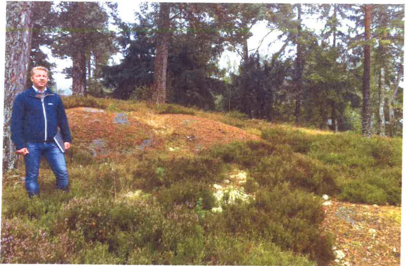
Terräng där ny väg dras, sedd från norr, ungefär mitt på vägsträckan

Ny väg dras terränganpassat med hög acceptans av ojämnheter, lutning i sidled och inslag av bar håll samt undvikande av avverkning av vuxna träd. Håligheter fylls ut med bärlager av packad makadam. Släntningar beläggs med matjord som besås med gräsblandning av ängsgrästyp. Bergschakt/sprängning skall undvikas. Ytbeläggning på väg utförs med blandat naturgrus.