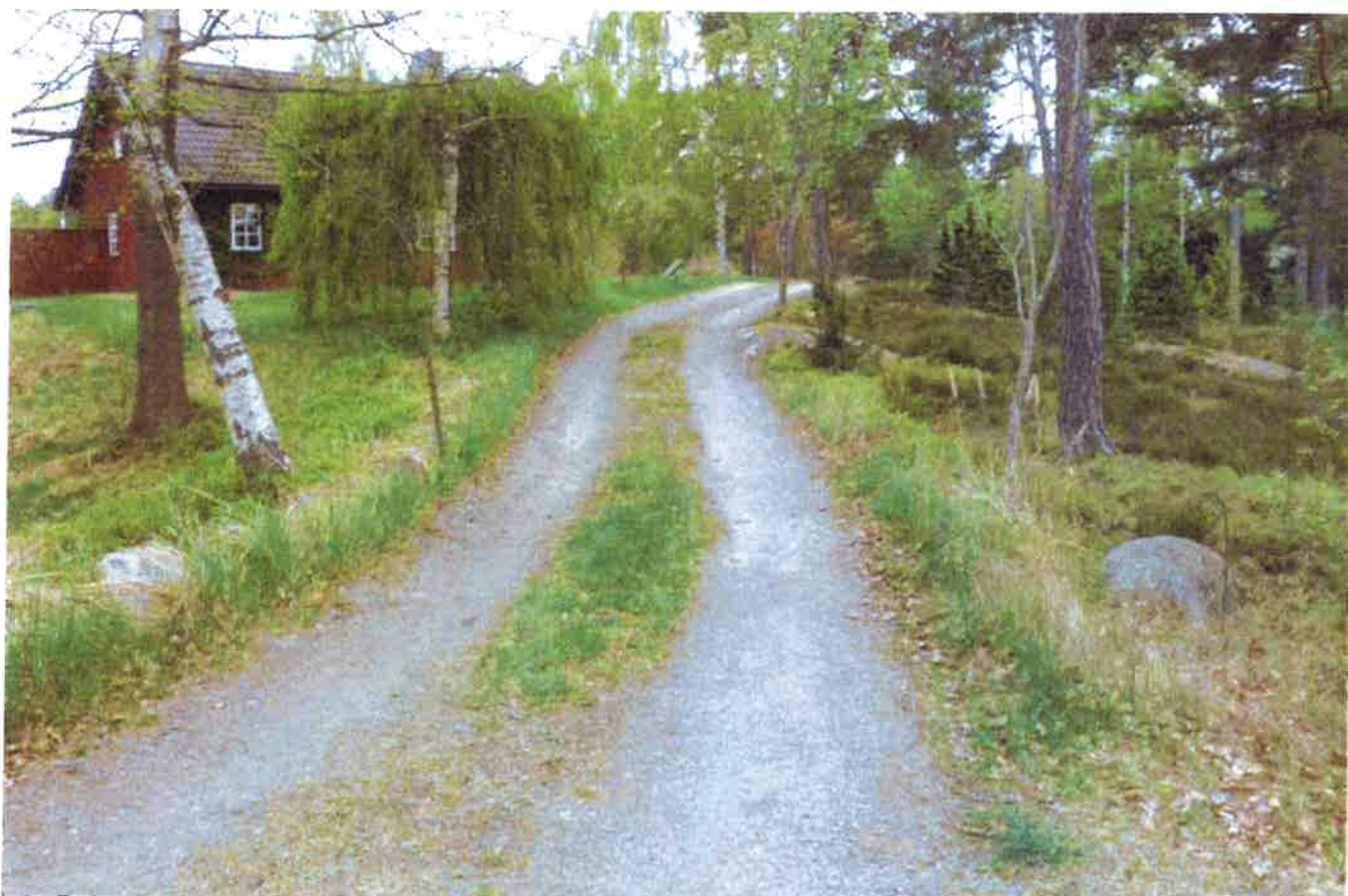
Befintlig väg som läggs igen, sedd från nordöst

Ambitionen är att genom omsorgsfull terrängbearbetning diffusera/"sudda bort" befintlig vägkontur och läka ihop skärgårdsnatur och trädgårdsnatur där även håll i dagen och topografiska variationer får framgå.