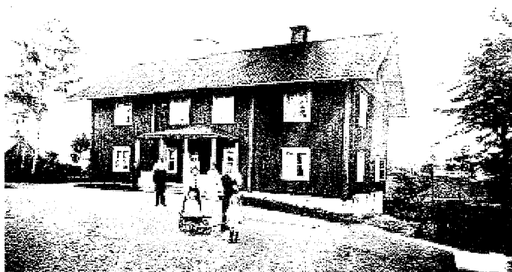
Alby prästgård ca år 1900 med prästens familj framför.