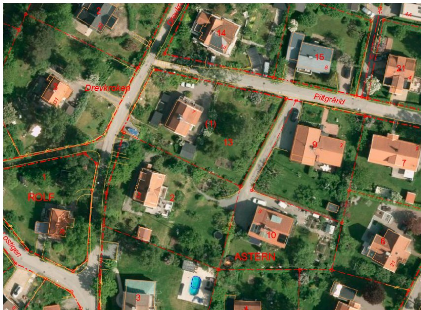
Figur 2. Ortofoto – baskarta med fastigheterna Astern 2 och Astern 13.

Syftet med den föreslagna detaljplanen är att ge möjlighet för avstyckning av fastigheterna Astern 2 och Astern 13 och därmed möjlighet att uppföra ytterligare två småhus i kvarteret.