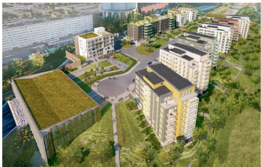
Figur 3. Flygvy mot sydväst (ÅWL arkitekter).