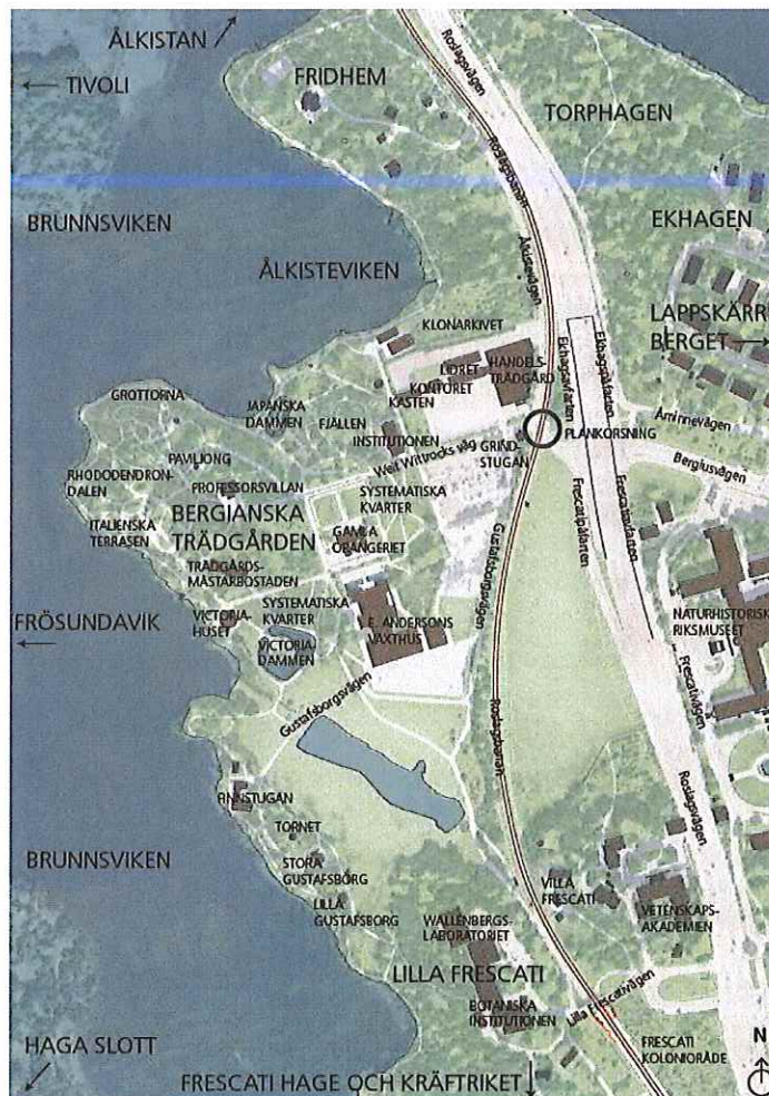
Figur 1. Befintlig plankorsning inringad i svart.

Befintlig plankorsning är olycksdrabbad även om situationen har förbättrats sedan den intilliggande stationen på Roslagsbanan flyttades söderut där en planskild passage finns och nya hinderdetektorer installerats vid plankorsningen.