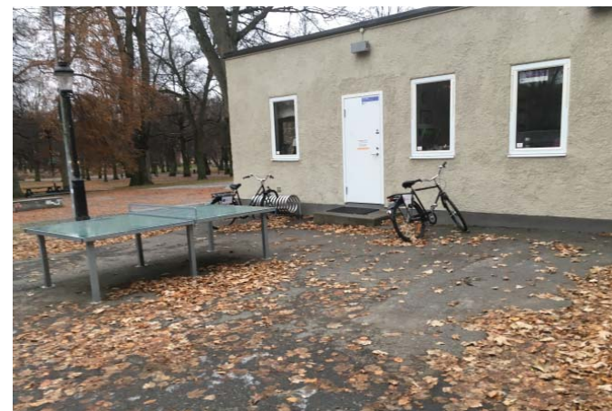
Gårdsyta med pingisbord och cykelparkering.

Humlanhuset och miljön runt om är främst ett arv från 50-talets upprustning där lekplatsen, i funktionalistisk anda, separerades i en parklek för de mindre barnen i norr och en idrottsplats för de äldre barnen i anslutning till toaletter och parkförvaltningens byggnader i väster. De båda bollplanerna, löparbanan och de östra terrasserna är exempel på element som finns kvar från denna epok. (För mer information om parkens historiska värden, se "Parkdokument för Humlegården – historik, mål och åtgärder, Gatu- och fastighetskontoret, Stockholm 2004.)