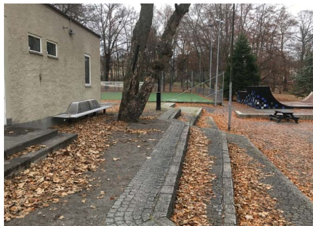
Terrasser ritade av arkitekt Eric Glemme.

Utefter inkomna synpunkter togs en skiss fram. Skissen visades den 6:e mars 2017 för verksamheten i Humlanhuset och ungdomsrådet (representerade av Jamila Lodhi respektive Max Igor Kajanus). Bl.a. framkom vikten av en tydligare avgränsning mellan skate och basket, att grillplatsen skulle placeras vid huvudentrén för god uppsikt och önskemål om blomsterplanteringar och effektbelysning av exempelvis träd.