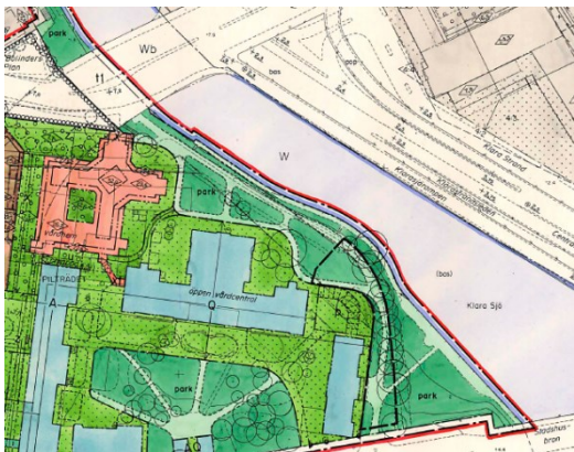
Serafimerstranden. Dp 6958. (1981)

Kontoret kan konstatera att de nu föreslagna platserna alla är detaljplanelagda som park- eller naturmark. Där broarna är finns dock också planstöd för att bro får uppföras.