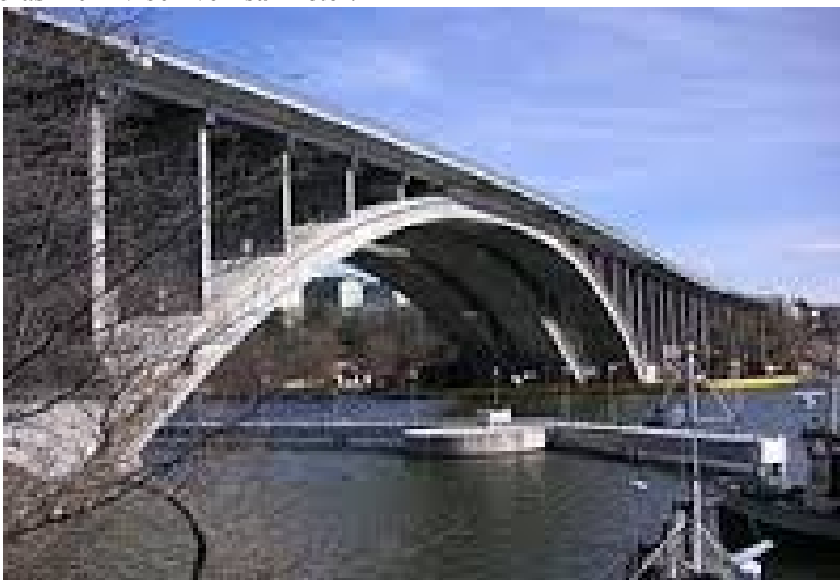
Foto: Tranebergsbron är ett exempel på en lång bro, med ödsliga ytor inunder, som skulle tjäna på att göras mer levande.

Förvaltningen ställer sig positiv motionen som vi finner till-talande. Ska staden upplevas som trevlig för dess invånare är det angeläget att uterummet står i samklang med stadens gestaltning och identitet och görs mer levande och intressant. Utrymmena under broarna är många gånger ödsliga platser som skulle tjäna på att tillföras mer liv och verksamheter.