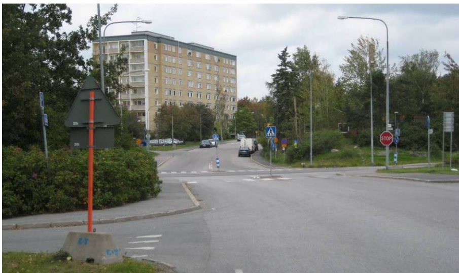
Ältabergsvägens korsning med Ältavägen är oreglerad idag.

Trafikverket planerar att göra en förstudie för säkerhetshöjande åtgärder i korsningen Ältavägen - Ältabergsvägen, i anslutning till planområdet. Idag är korsningen oreglerad, men ökande trafik medför ett behov av trafikljus alternativt cirkulationsplats, enligt av WSP 2010 framtagen trafikanalys för södra Älta. En lösning med cirkulationsplats ryms inom den gällande detaljplanen för området.