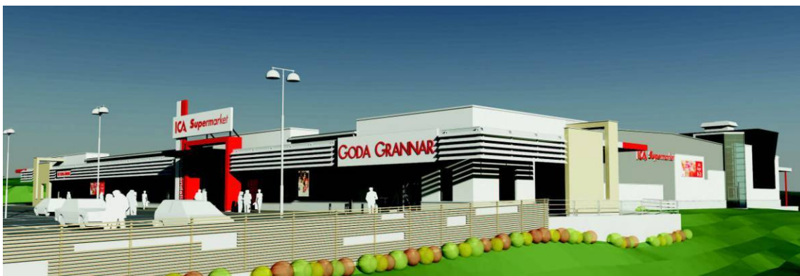
Vy från nordväst med parkeringens mur och bländskydd

God utomhusbelysning ska anordnas inom kvartersmark för att ge trygghet.