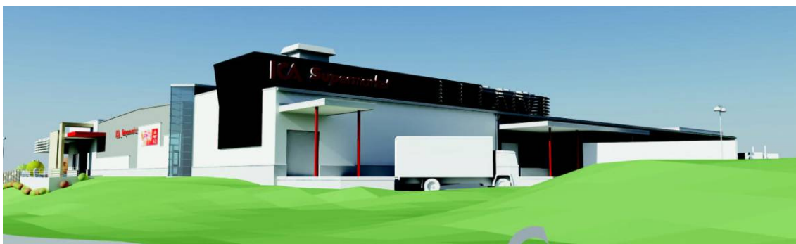
Vy från sydväst med Tyresövägens avfart till vänster.