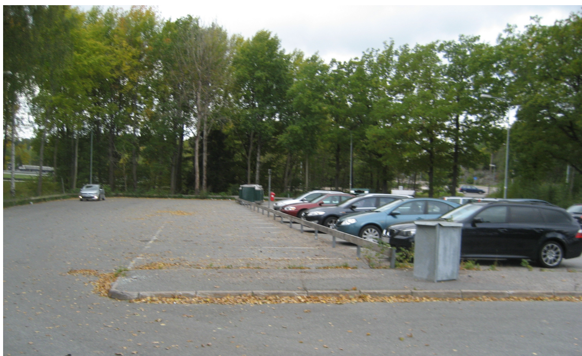
I norra delen av planområdet finns en infartsparkering som är måttligt utnyttjad. Här finns också en återvinningsstation.

Grundvattenströmningen bedöms ske mot Drevviken.