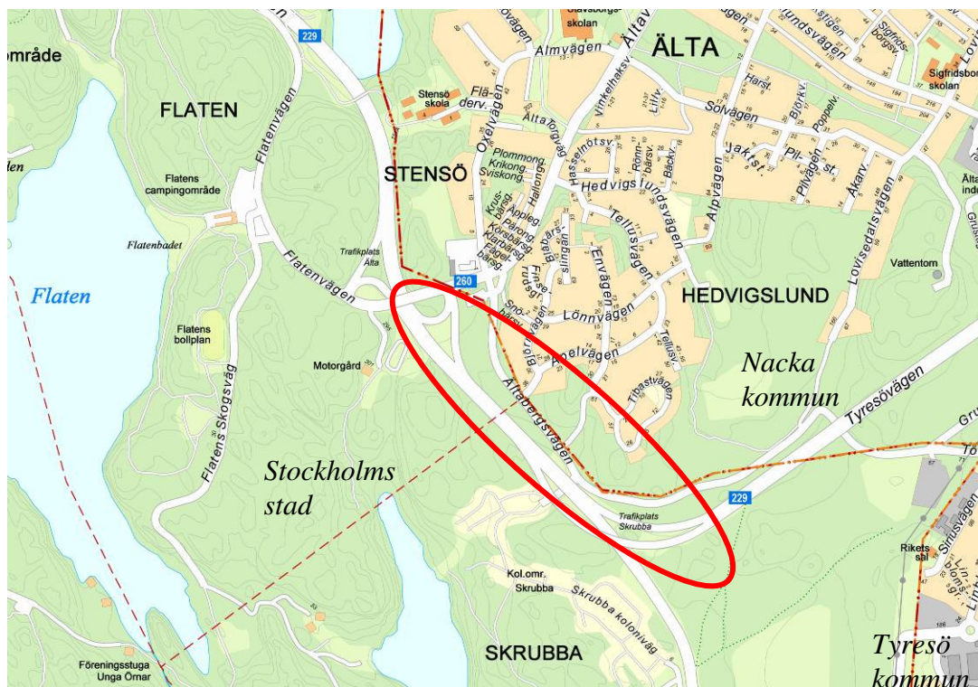
Översiktskarta, planområdets läge

Skrubba 1:1 och Skarpnäcks Gård 1:1 ägs av Stockholms stad. Älta 10:1 ägs av Nacka kommun, medan Älta s:3 ägs samfällt av över 100 fastighetsägare.