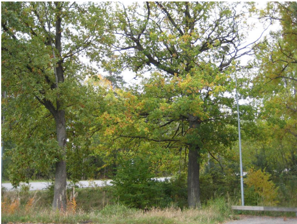
I området växer mest lövsly men också ekar