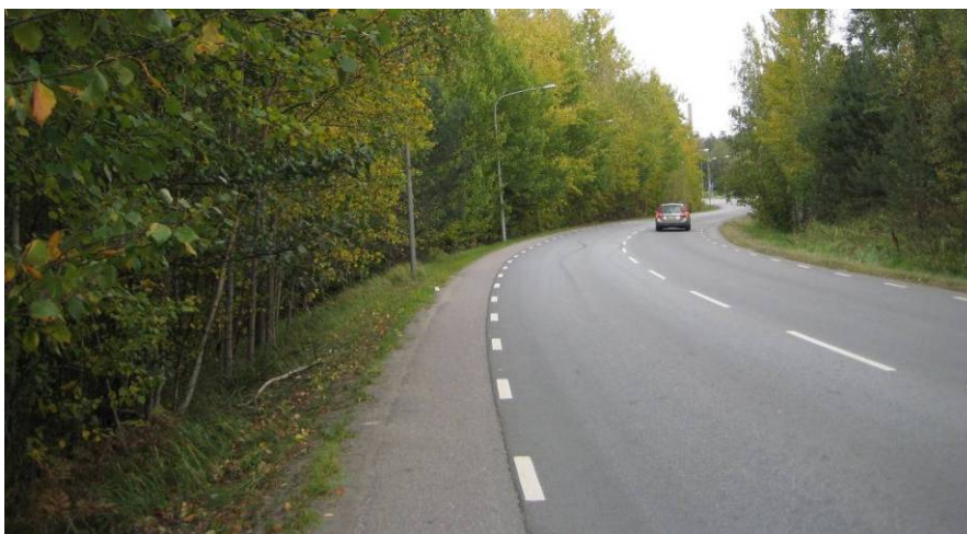
GC-bana kan anläggas längs Ältabergsvägen i stort sett inom befintligt vägområde.

GC-banan ingår i det regionala GC-vägnätet och ansluter till befintlig GC-väg österut mot Hellasgården och Sicklaön i korsningen av Ältavägen/Ältabergsvägen. Det finns ett stort önskemål om att det regionala cykelstråket knyts samman även i väster, där den genaste cykelvägen till centrala Stockholm går. När Ältabergsvägen får separat gång- och cykelbana saknas endast separat cykelbana på sträckan mellan Ältabergsvägen och Flatenbadet, för att cykelstråken i de sydöstra delarna av regionen och stråken i sydöstra Stockholm ska hänga samman.