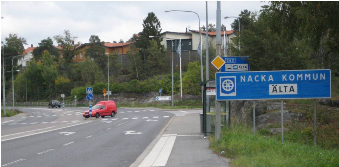
Planområdet, till höger i bild, är del av den västra entrén till Nacka och Älta