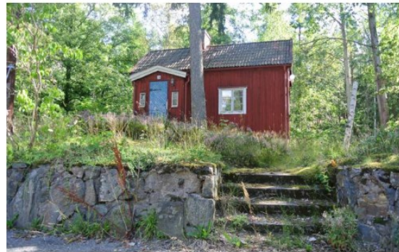
Aldre torp vid Korkskruven.

Skogen har en viktig funktion som spridningskorridor till skogsområdet i öster. Stambanan utgör dock en mycket stark barriär mellan områdena och är svår att ta sig över för både människor och djur. Området närmast järnvägen är bullerpåverkat.