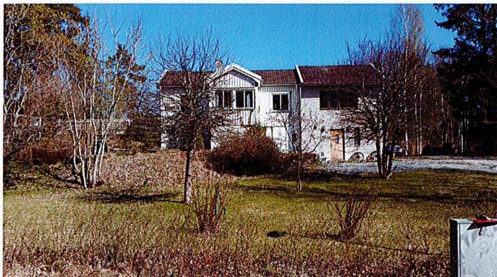
Fotot visar den befintliga huvudbyggnaden på fastigheten Strand 1:120

tydligt i det nordvästra hörnet med en markant höjdskillnad på 4 meter medan den södra delen är mer flack. Vegetation är blandad och skiftar mellan löv och barrträd.