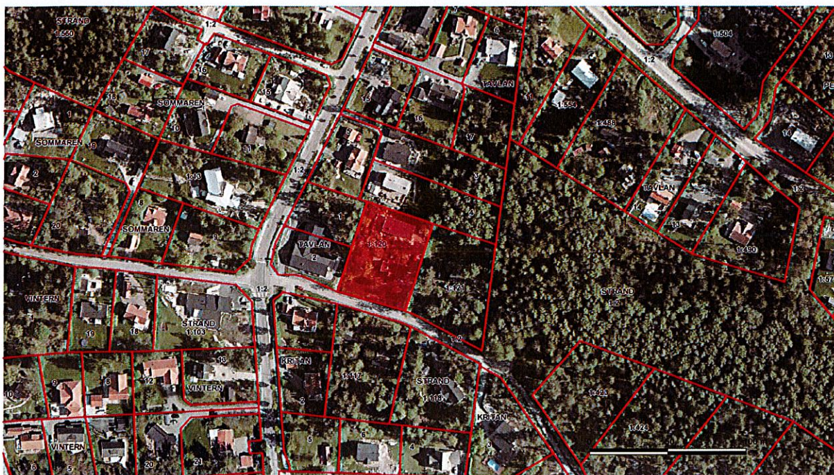
Den aktuella fastigheten markerad i rött.