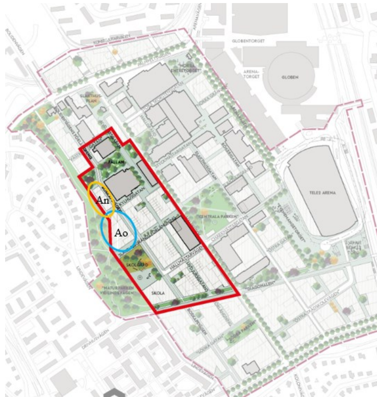
Bild över Slakthusområdet. Röd markering visar etappgränsen. Blå markering visar kvarter för studentbostäder och idrottshall. Gul markering visar kvarter för forskarbostäder.

En direktanvisning görs för idrottshall till Fastighetskontoret. Idrottshallen samordnas med bostäder. Svenska Studenthus Holding 1 AB får markanvisning för student- och forskarbostäder samt förskola.