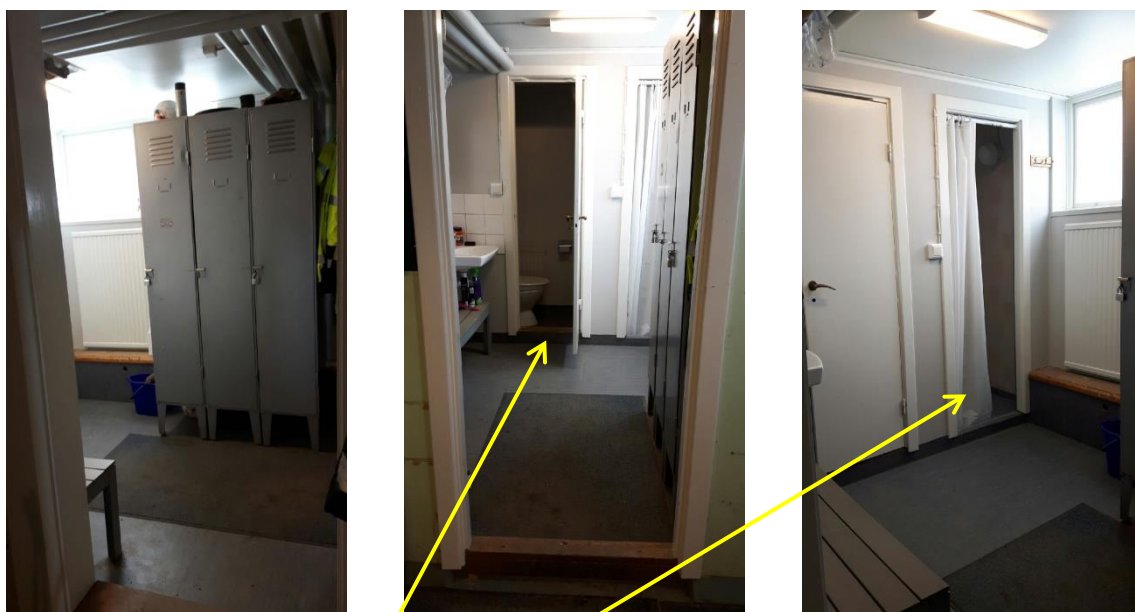
Ett omklädningsrum, en toalett och en dusch i samma utrymme (7 kvm)

De gemensamma utrymmena (matrum, omklädningsrum, tvätt, dusch och toalett) är mycket trånga och opraktiska. Det finns inte skilda dam- och herrutrymmen avseende omklädning (ett litet utrymme), toalett (en) och dusch (en). Idag arbetar här tre män och en kvinna. Feriejobbare kan förekomma av båda könen. I och med utvecklingen av Alby och fler naturreservat kommer personalstyrkan med all sannolikhet att behöva utökas. Det finns ingen tillgänglighetsanpassning över huvudtaget i nuvarande lokaler. Personalen har väldigt mycket varierande arbetsuppgifter sommar som vinter och har därför mycket arbetskläder för olika ändamål och väder. Tvättmaskin och torkutrymmen används i stort sett dagligen. Ljudnivån på ventilationen i gemensamma personalutrymmen är hög och tröttande. Även drag från ventilation är starkt (gardinerna fladdrar).