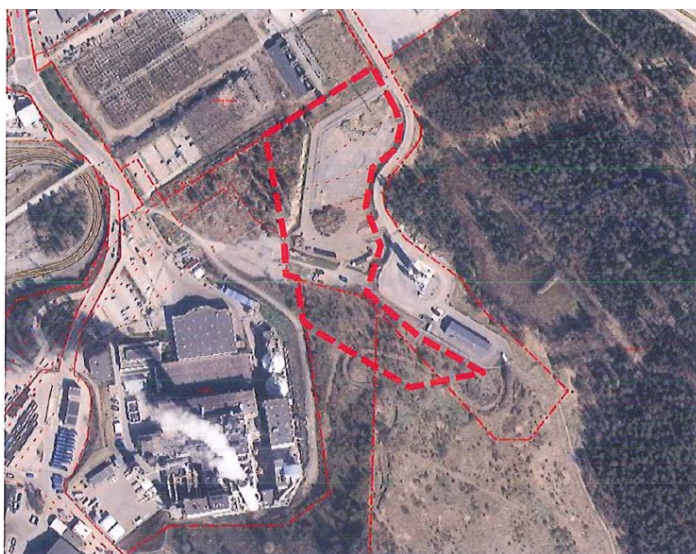
Kartskiss, markanvisat område till Stockholm Vatten och Avfall AB, 2015-09-24

Exploateringsnämnden har markanvisat två områden som berör det aktuella området. Det ena området har markanvisats till Stockholm Vatten och Avfall AB den 24 september 2015 för en ny anläggning för mottagning, sortering och förbehandling av matavfall, se kartskiss nedan.