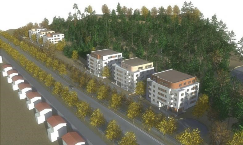
Perspektiv med volymstudie av de föreslagna byggnaderna i relation till villabebyggelsen på andra sidan Drottningholmsvägen och skogen på berget i bakkanten. Illustration: Brunberg & Forshed Arkitektkontor