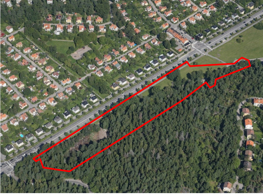
Planområdet markerat med rött på sned flygbild sedd mot norr.