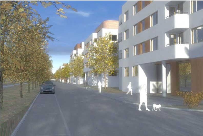
Principiell illustration över bebyggelsen och den nya angöringsvägen. parkering löses delvis som kantstensparkering. Illustration: Brunnberg & Forshed Arkitektkontor