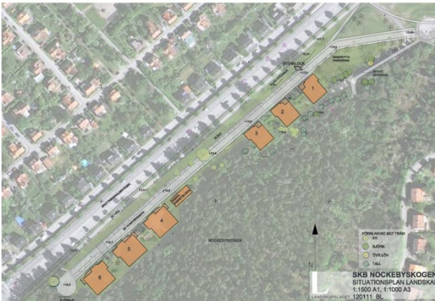
Situationsplan. Illustration: Landskapslaget / Brunberg & Forshed Arkitektkontor