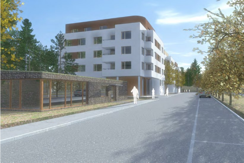
Centralt i området föreslås en mindre gemensamhetslokal uppföras för de boende. Illustration: Brunnberg & Forshed Arkitektkontor