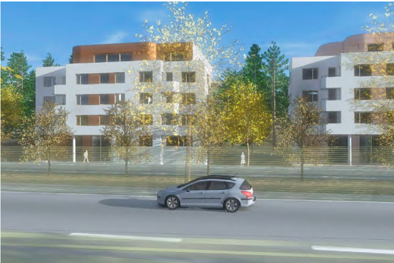
Vy från Drottningholmsvägen mot den nya bebyggelsen. Ett skyddsplank tillkommer längs vägen. Planket utformas för att ansluta till befintligt bullerplank längs Drottningholmsvägen. Illustration: Brunberg & Forshed Arkitektkontor