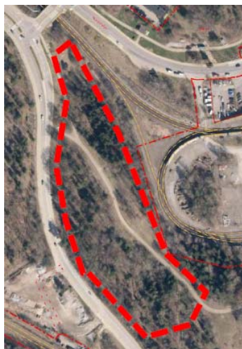
Markanvisat område till Fastighets AB Brostaden

Detta kontorsyttrande avviker något från det gemensamma yttrandet som Exploateringskontoret och de fem andra kontoren lämnade till Kommunstyrelsen, och det avviker således också något från det yttrande som Kommunstyrelsen lämnade till Energimarknadsinspektionen.